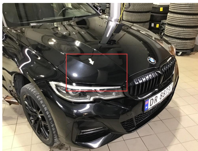
1.2 Noe steinsprut på panser, flekkes.