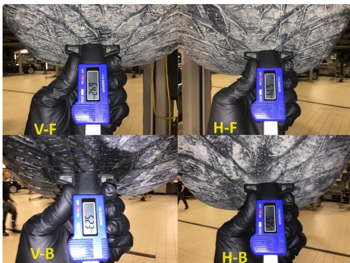
1.4 Mønsterdybde vinterdekk målt ved takst 04.04.24, 62.203km.