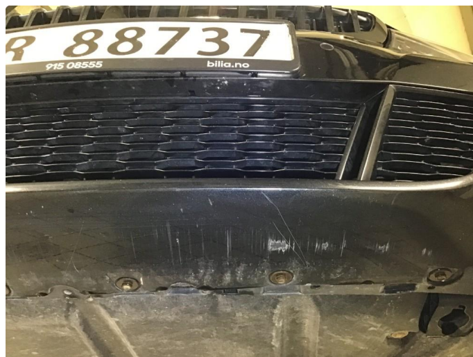
1.5 Noen skrubbermerker underkant fremfanger, regnes som normal bruksslitasje.