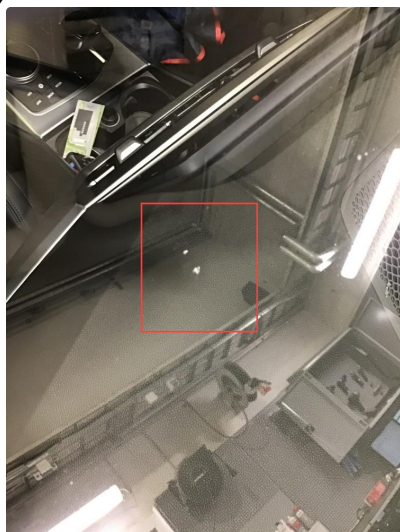
1.6 Noen steinsprut på frontrute, reparert.