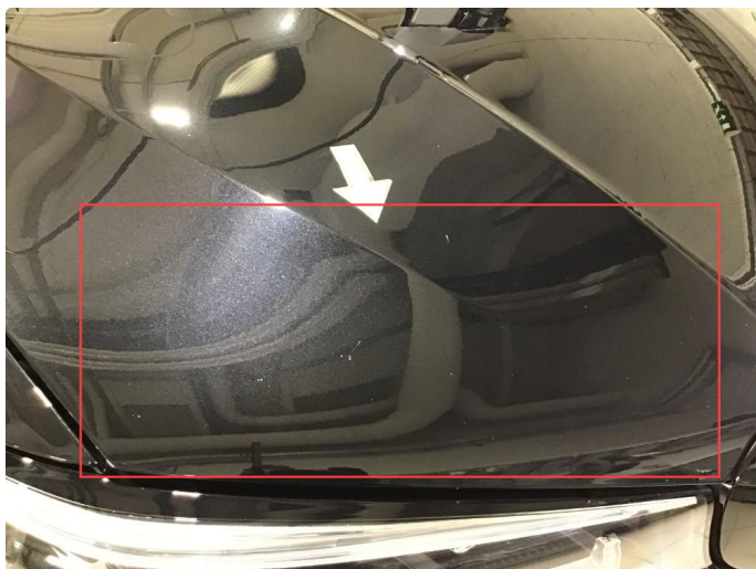
1.2 Noe steinsprut på panser, flekkes.