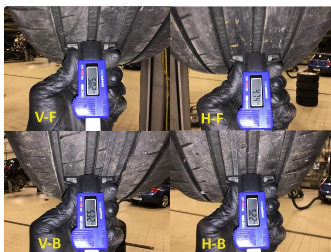
1.2 Mønsterdybde sommerdekk målt ved takst 13.05.24, 32.567km.