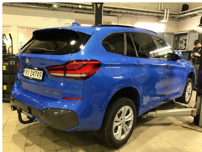
1.1 Oversiktsbilder av bilen.