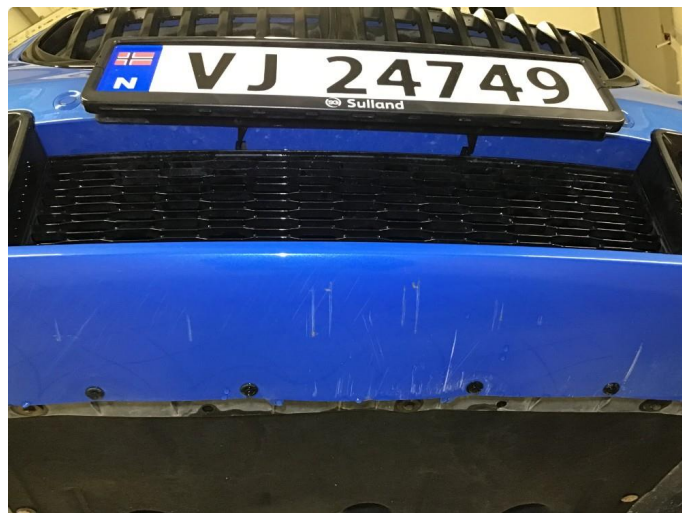
1.4 Noen skrubbermerker underkant fremfanger, regnes som normal bruksslitasje.