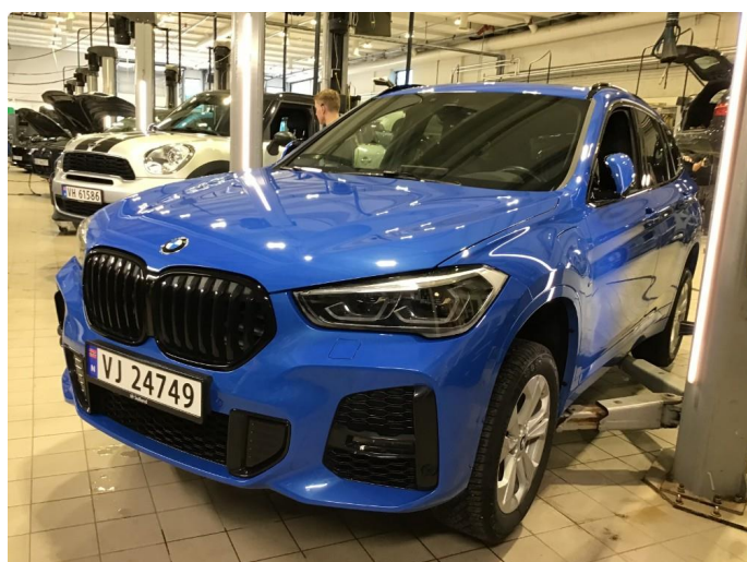
1.1 Oversiktsbilder av bilen.