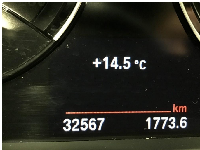
1.1 Oversiktsbilder av bilen.