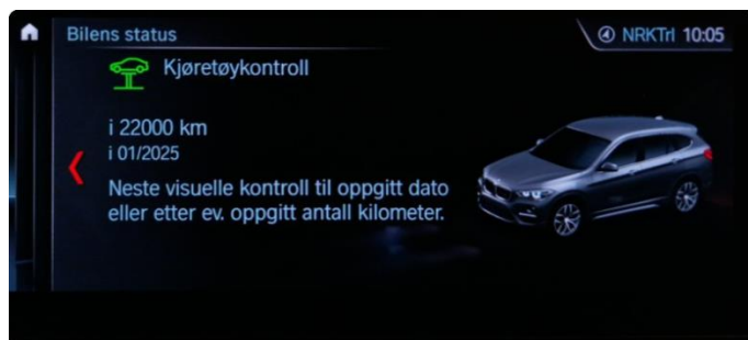
2.1 Neste service 01.2025/22.000km.