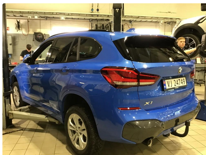
1.1 Oversiktsbilder av bilen.