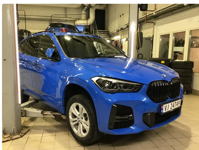
1.1 Oversiktsbilder av bilen.