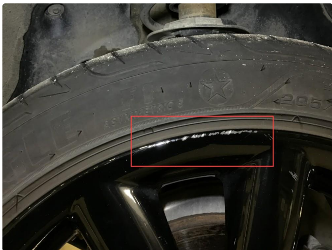
1.2 Noen bruksmerker på 2 sommerfelger. regnes som normal bruksslitasje.