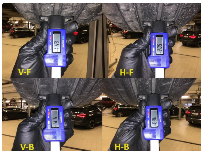
1.3 Mønsterdybde sommerdekk målt ved takst 10.07.2024, 59.576km.