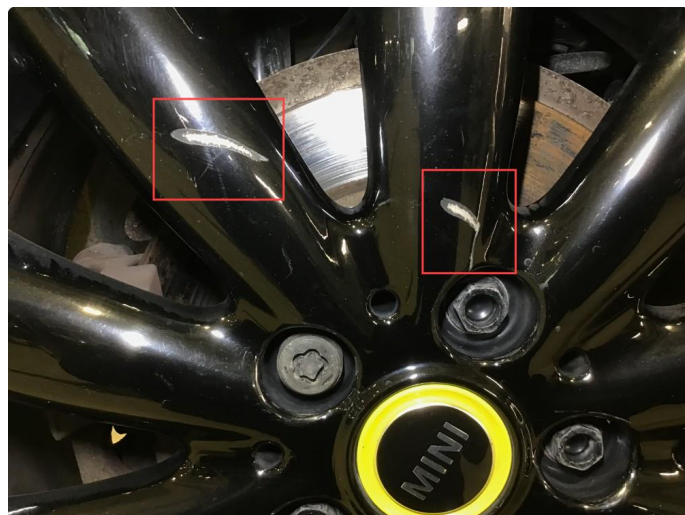
1.2 Noen bruksmerker på 2 sommerfelger. regnes som normal bruksslitasje.