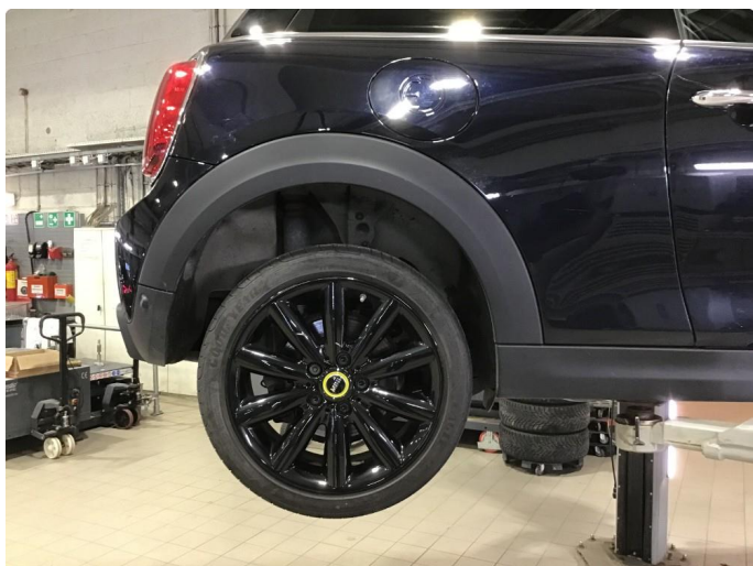
1.2 Noen bruksmerker på 2 sommerfelger. regnes som normal bruksslitasje.