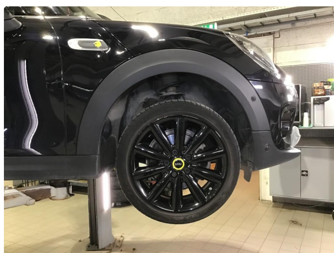
1.2 Noen bruksmerker på 2 sommerfelger. regnes som normal bruksslitasje.