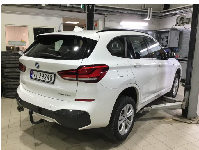
1.1 Oversiktsbilde av bilen.