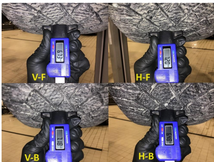
1.3 Mønsterdybde vinterdekk målt ved takst 22.11.23, 36.304km.