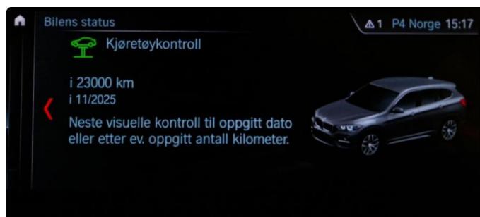
2.1 Neste service 11.2025/23.000km. Bilen har en aktiv serviceavtale til bilen er 3år eller har gått 60.000km, hva som først inntreffer.