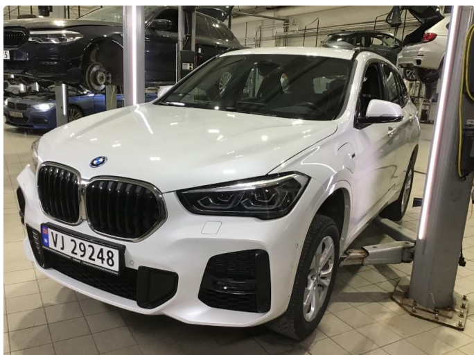
1.1 Oversiktsbilde av bilen.