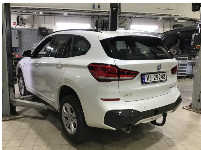
1.1 Oversiktsbilde av bilen.