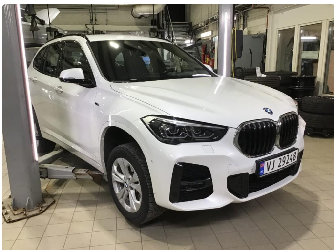
1.1 Oversiktsbilde av bilen.