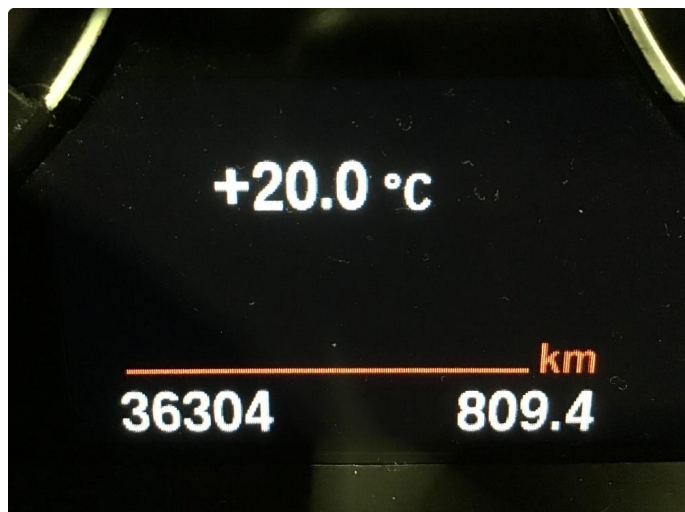
1.1 Oversiktsbilde av bilen.