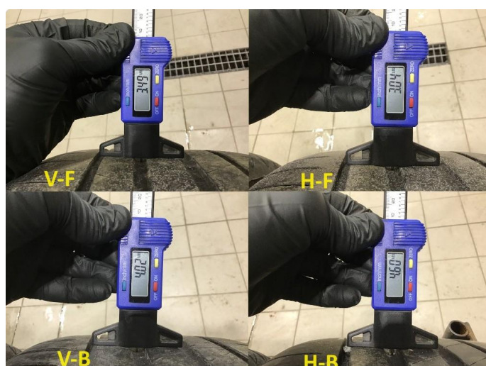
1.2 Mønsterdybde sommerdekk målt ved takst 22.11.23, 36.304km.