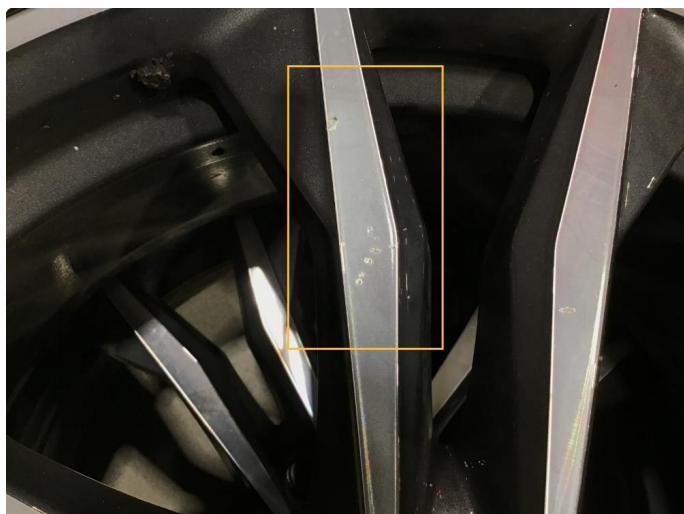
1.4 Noen små bruksmerker på 3 sommerfelger, regnes som normal bruksslitasje.