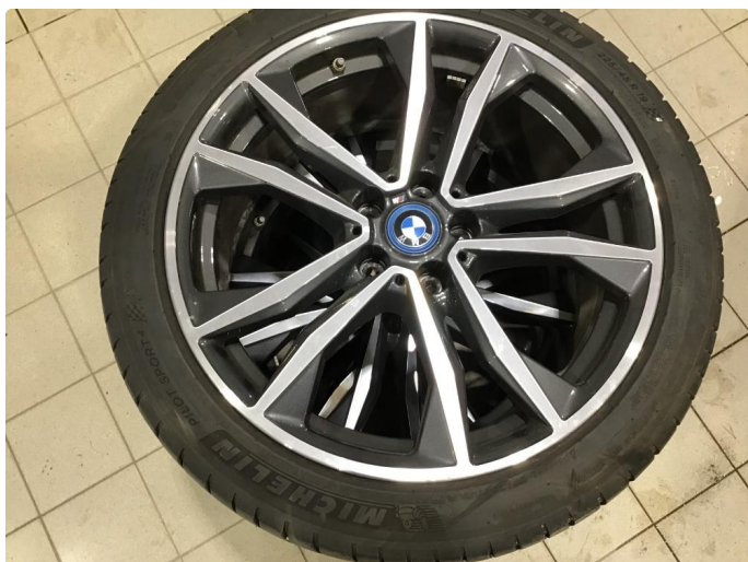
1.4 Noen små bruksmerker på 3 sommerfelger, regnes som normal bruksslitasje.