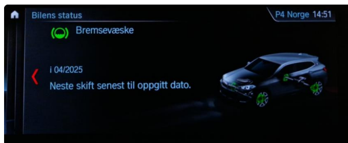
2.1 Neste service 04/2025. Bilen har en aktiv serviceavtale til bilen er 3 år eller har gått 60.000km, hva som først inntreffer.