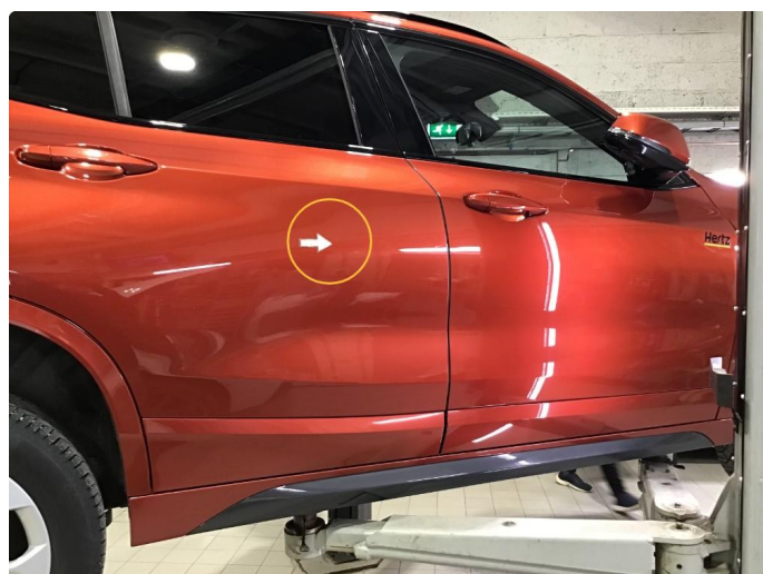
1.2 Liten p-bulk h-bakdør, regnes som normal bruksslitasje.