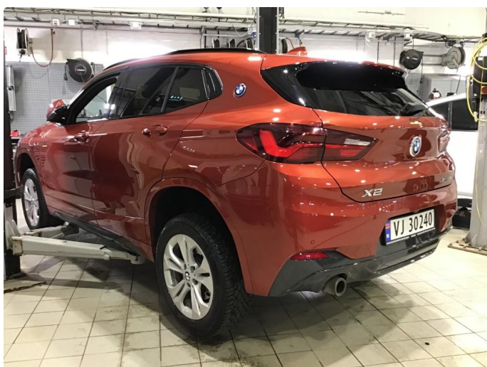
1.1 Oversiktsbilde av bilen.