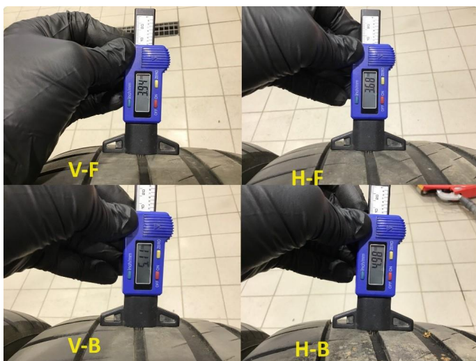
1.5 Mønsterdybde sommerdekk målt ved takst 01.03.24, 41.854km.