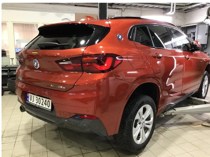
1.1 Oversiktsbilde av bilen.