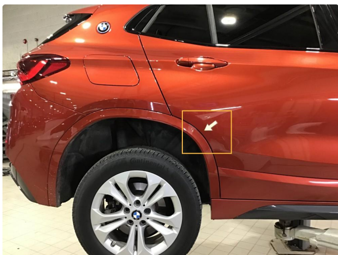
1.3 Lite lakksår skjermutbygger h-bak, flikkes og poleres.