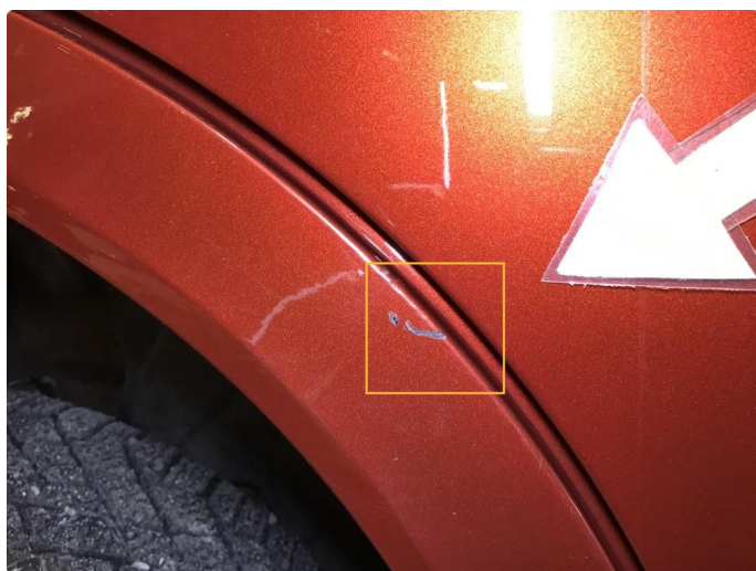
1.3 Lite lakksår skjermutbygger h-bak, flikkes og poleres.