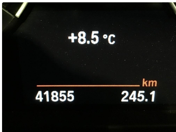
1.1 Oversiktsbilde av bilen.