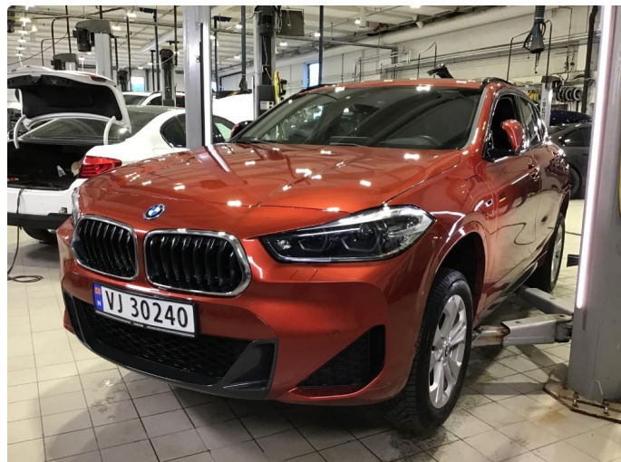
1.1 Oversiktsbilde av bilen.