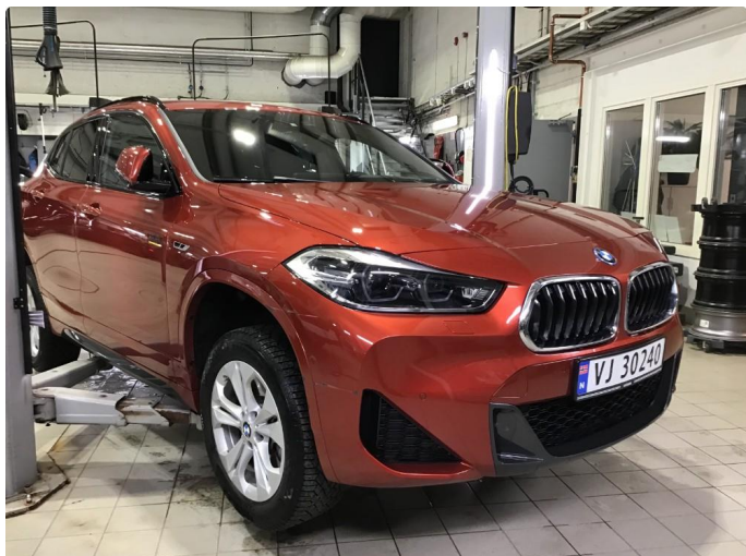
1.1 Oversiktsbilde av bilen.