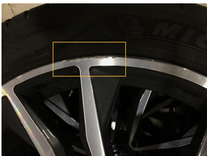
1.4 Noen små bruksmerker på 3 sommerfelger, regnes som normal bruksslitasje.