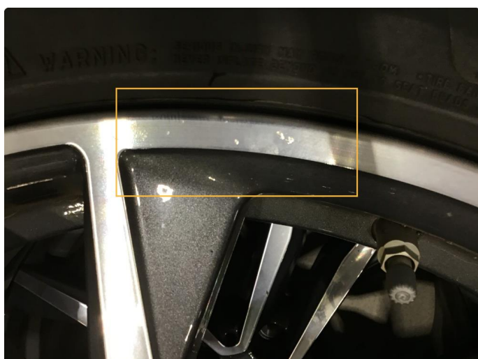
1.4 Noen små bruksmerker på 3 sommerfelger, regnes som normal bruksslitasje.