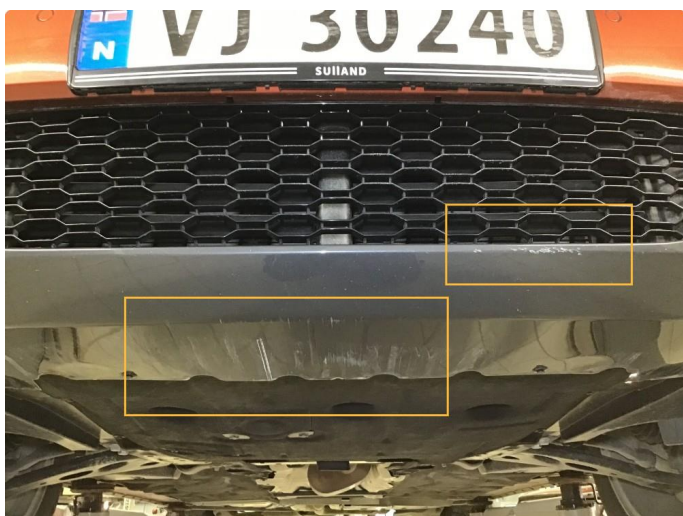
1.7 Noen skrubbermerker underkant fremfanger, regnes som normal bruksslitasje.