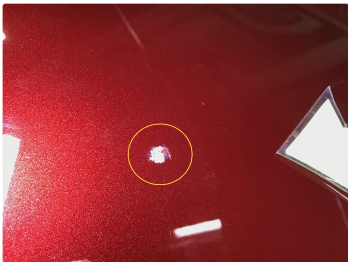
1.4 Lakksår h-framdør.