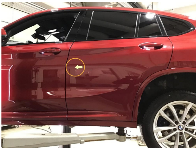
1.2 Liten p-bulk fremre del + noe riper bakre del h-bakdør ( Poleres )