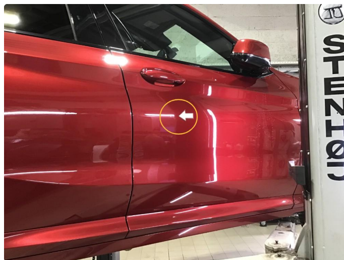
1.4 Lakksår h-framdør.