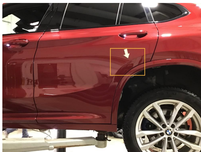
1.2 Liten p-bulk fremre del + noe riper bakre del h-bakdør ( Poleres )