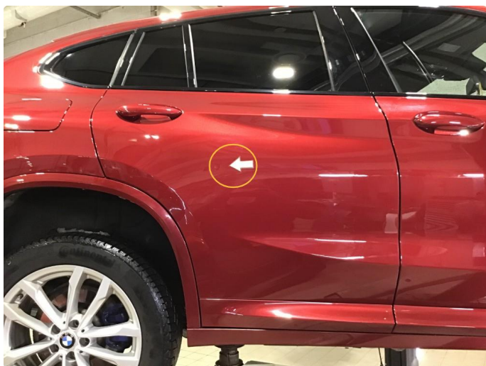
1.3 Liten p-bulk h-bakdør.