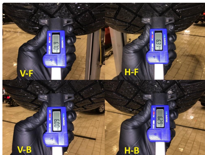
1.5 Nye vinterdekk påsatt etter takst.