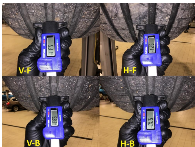
1.2 Mønsterdybde sommerdekk målt ved takst 16.10.2024, 15.124km.