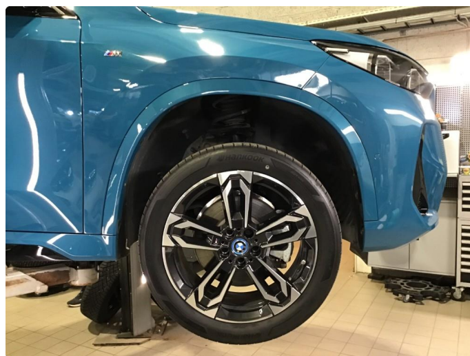
1.4 Lite bruksmerke på 1 sommerfelg.