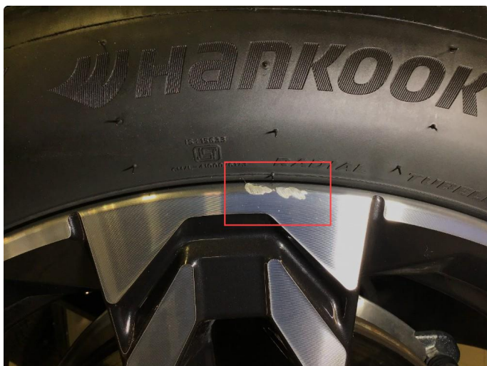
1.4 Lite bruksmerke på 1 sommerfelg.