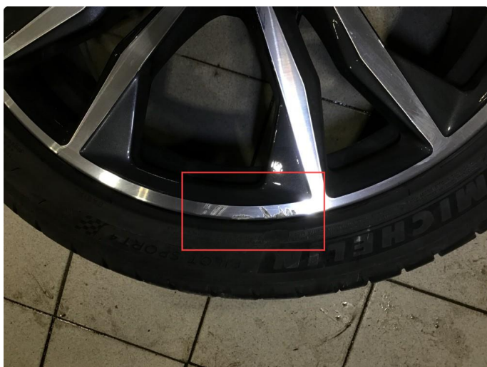
1.2 Noen bruksmerker 2 sommerfelger, regnes som normal bruksslitasje.