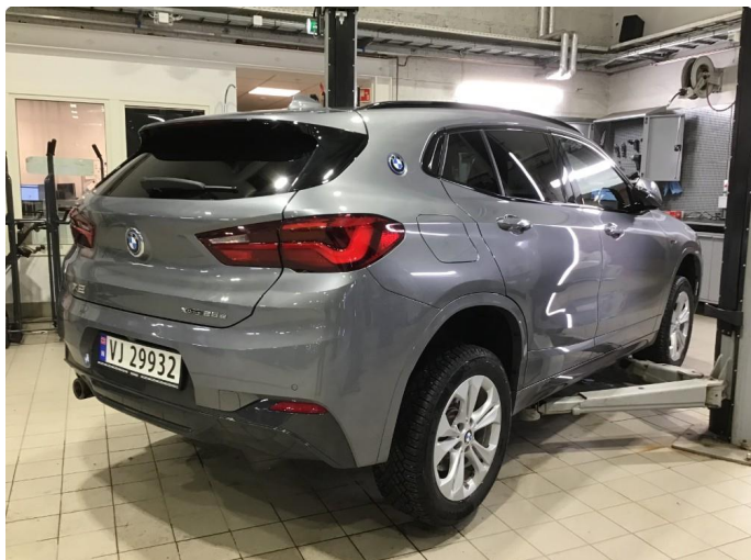
1.1 Oversiktsbilder av bilen.