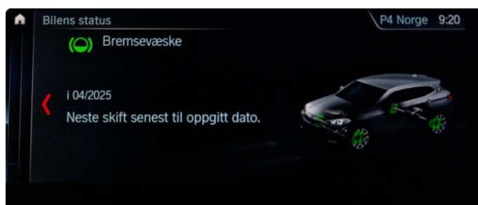
2.1 Neste service 04/2025. Bilen har en aktiv serviceavtale til bilen er 3 år eller har gått 60.000km, hva som først inntreffer.