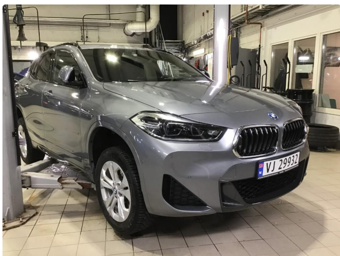
1.1 Oversiktsbilder av bilen.