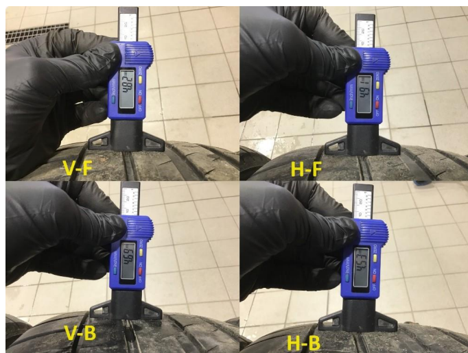
1.3 Mønsterdybde sommerdekk målt ved takst 26.01.24, 42.916km.