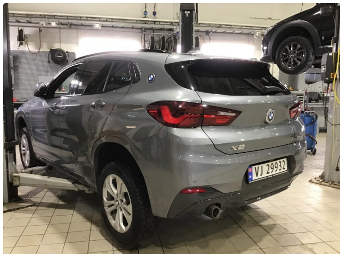
1.1 Oversiktsbilder av bilen.