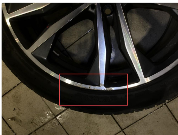
1.2 Noen bruksmerker 2 sommerfelger, regnes som normal bruksslitasje.