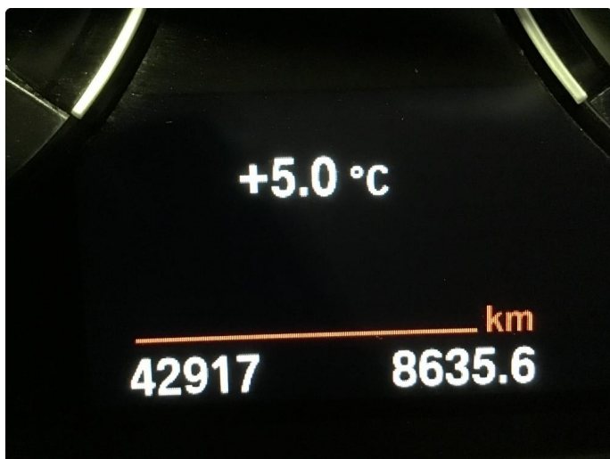
1.1 Oversiktsbilder av bilen.