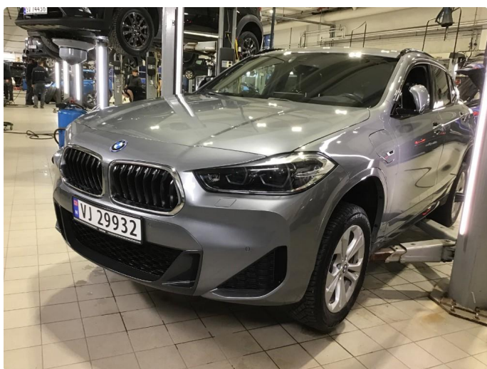
1.1 Oversiktsbilder av bilen.