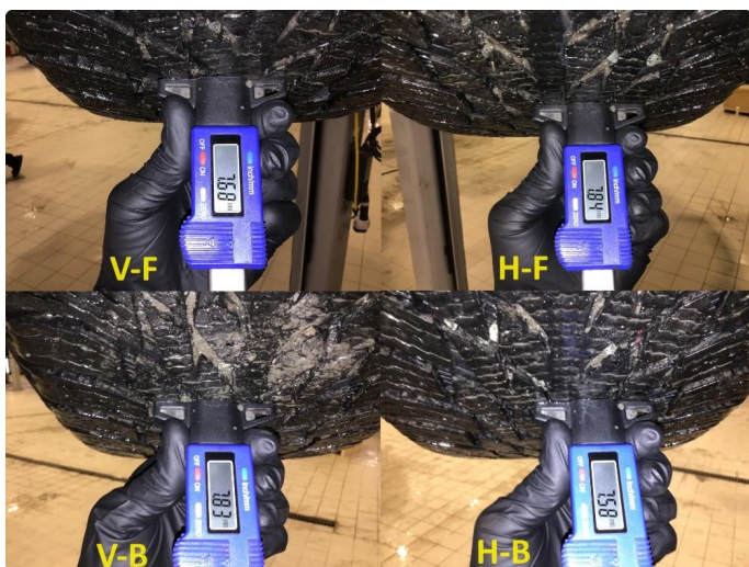
1.3 Mønsterdybde vinterdekk målt ved takst 04.12.24, 121.389km.