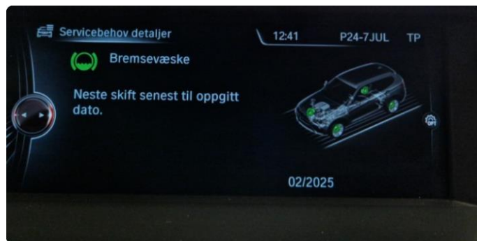
2.1 Neste service 02/2025.