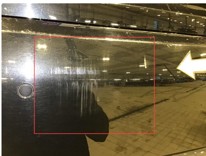
1.3 Noe bruksmerker på bakfanger, poleres.