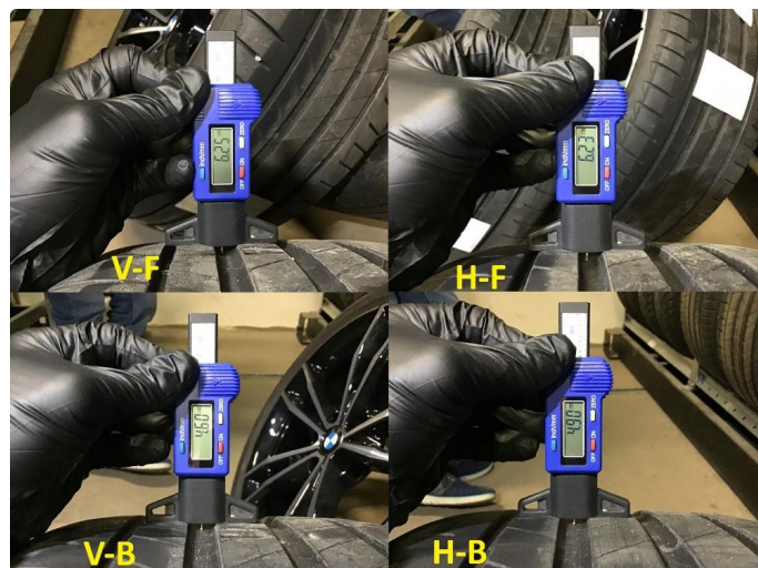
1.2 Mønsterdybde sommerdekk målt ved takst 24.01.2025, 20.093km.