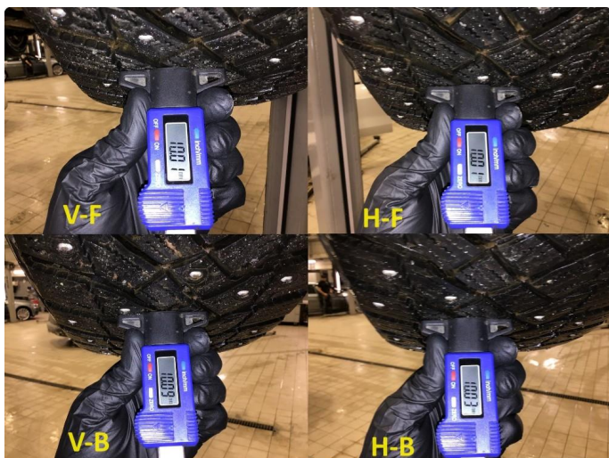
1.4 Mønsterdybde vinterdekk målt ved takst 20.12.23, 47.159km.