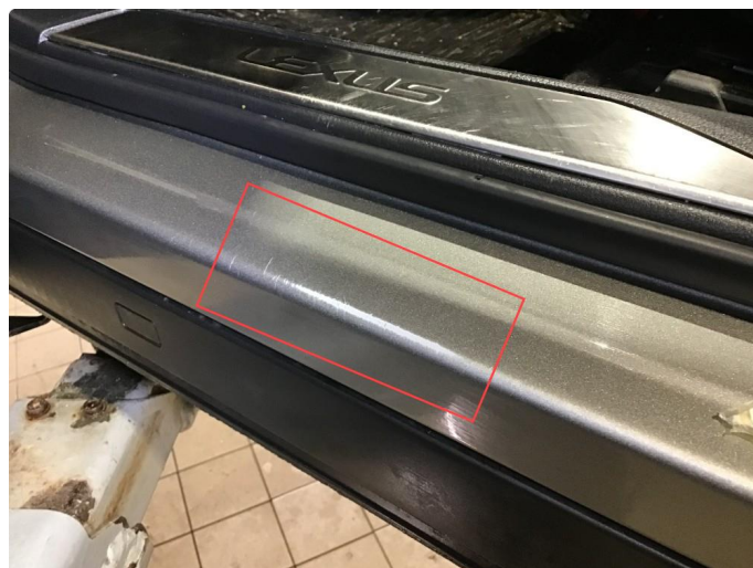
1.5 Noe slitasje innsteg førerside.