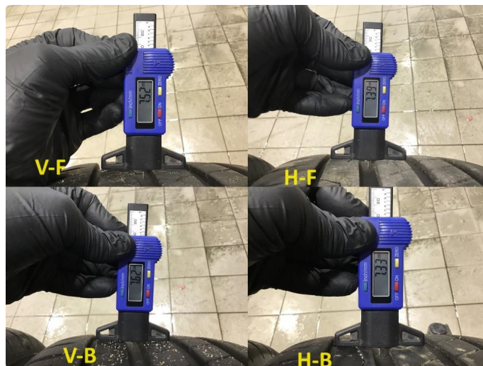
1.3 Mønsterdybde sommerdekk målt ved takst 20.12.23, 47.159km.