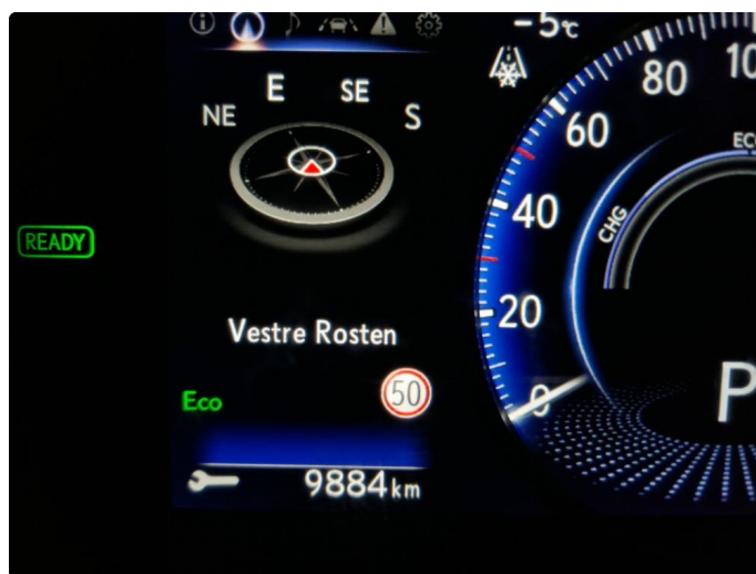
2.1 Neste service om 9.884km.