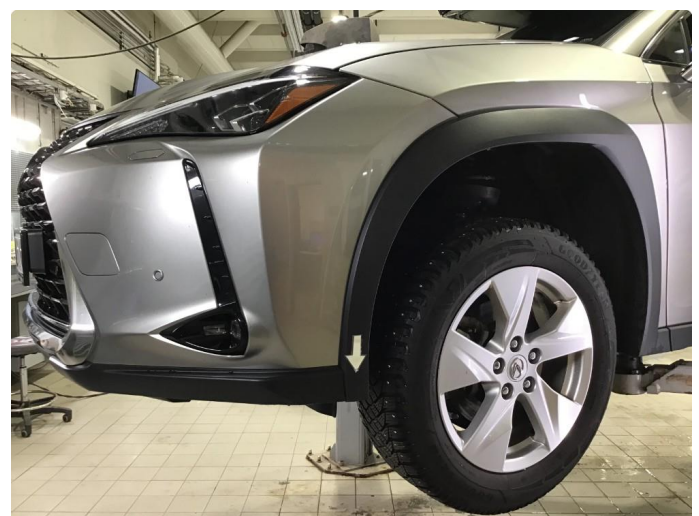
1.2 Bruksmerker plastikk på fanger.