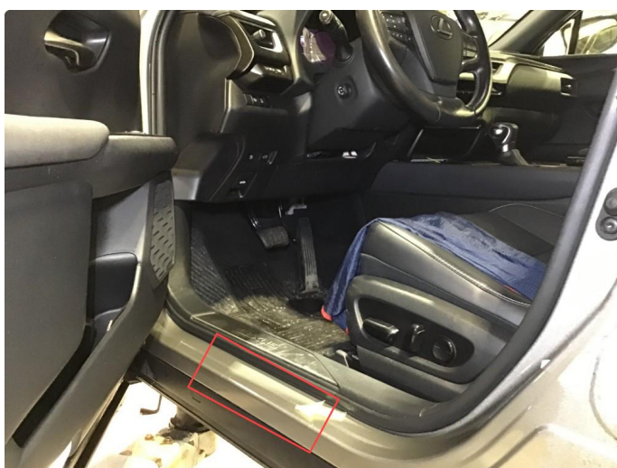
1.5 Noe slitasje innsteg førerside.