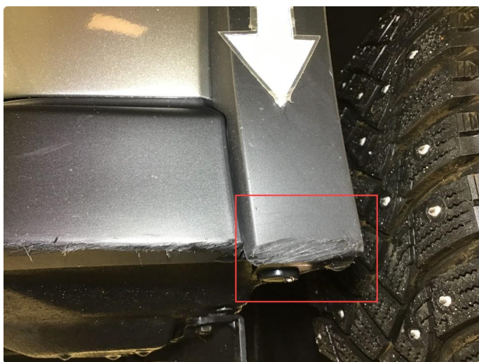
1.2 Bruksmerker plastikk på fanger.