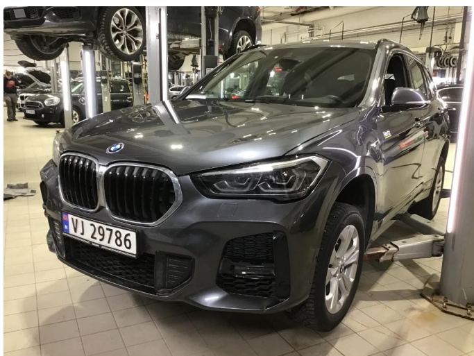
1.1 Oversiktsbilder av bilen.