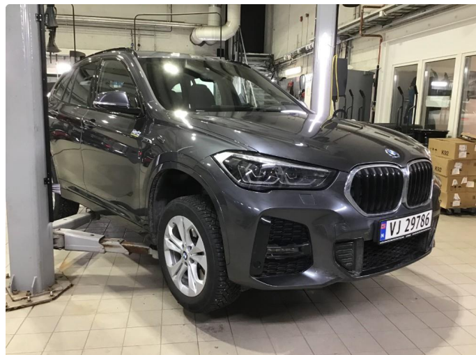
1.1 Oversiktsbilder av bilen.