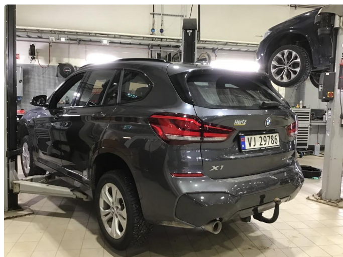
1.1 Oversiktsbilder av bilen.