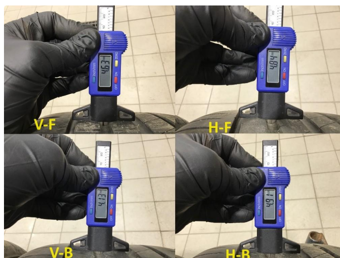
1.2 Mønsterdybde sommerdekk målt ved takst 10.01.2024, 30.733km.