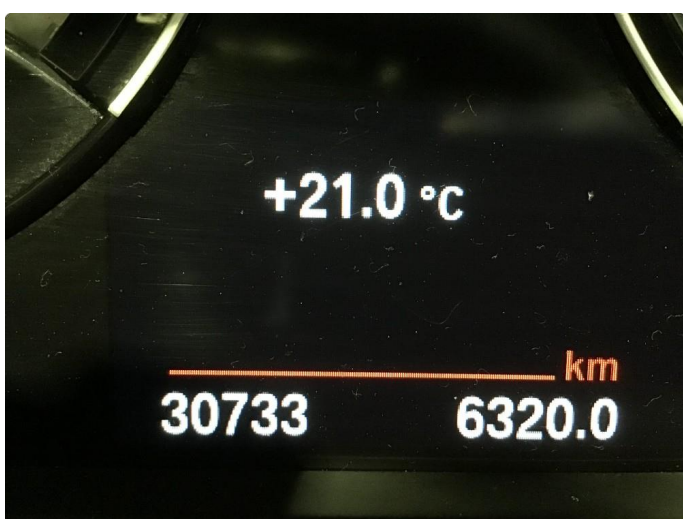
1.1 Oversiktsbilder av bilen.