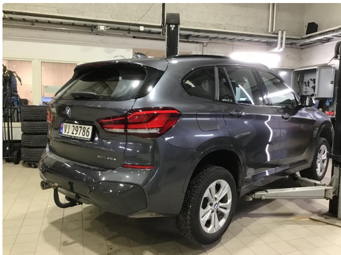
1.1 Oversiktsbilder av bilen.