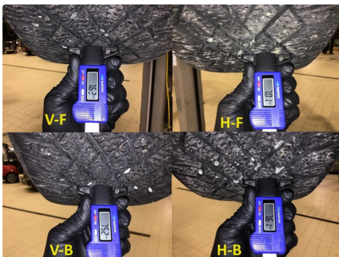
1.3 Mønsterdybde vinterdekk målt ved takst 10.01.2024, 30.733km.