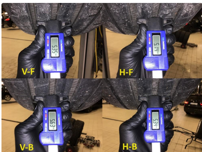
1.3 Mønsterdybde sommerdekk målt ved takst 20.08.2024, 12.837km.