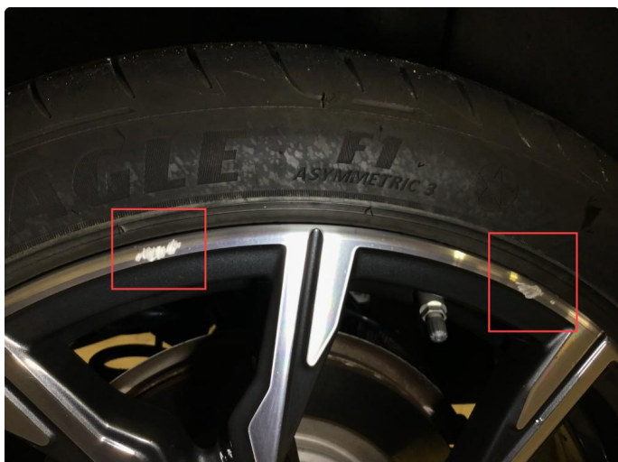
1.1 Noen bruksmerker på sommerfelg v-bak.