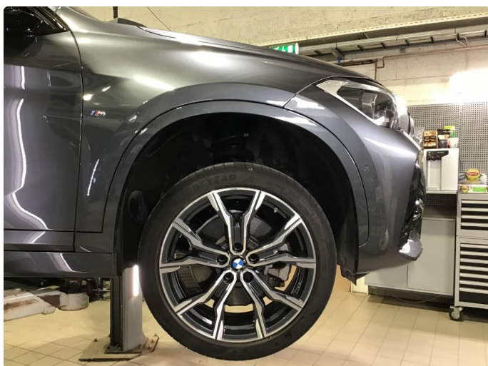
1.2 Noen bruksmerker på sommerfelg h-fremme.