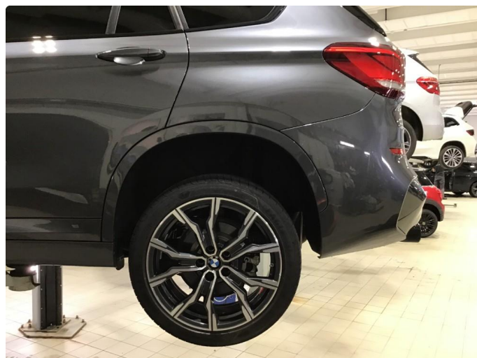
1.1 Noen bruksmerker på sommerfelg v-bak.