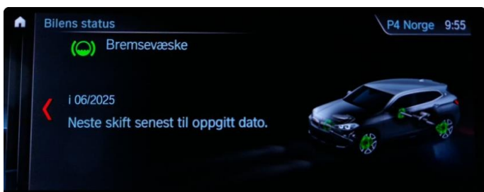
2.1 Neste service 06/2025. Bilen har en aktiv serviceavtale til bilen er 3 år eller har gått 60.000km, hva som først inntreffer.