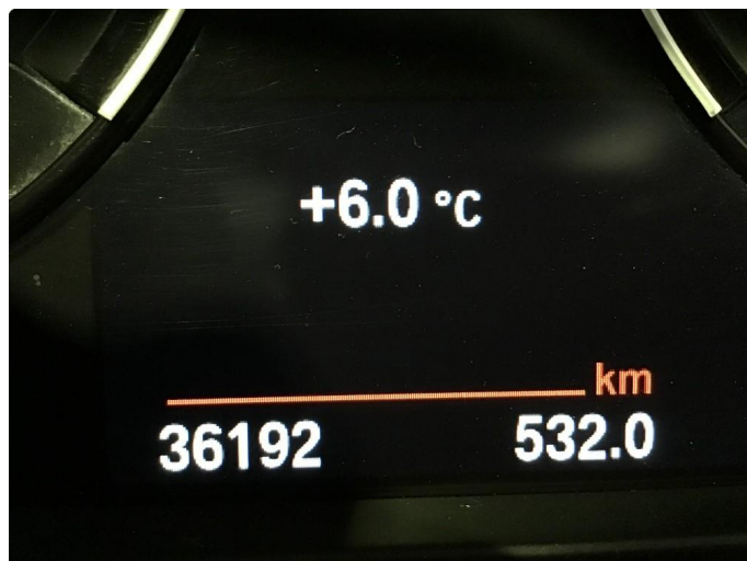
1.1 Oversiktsbilde av bilen.