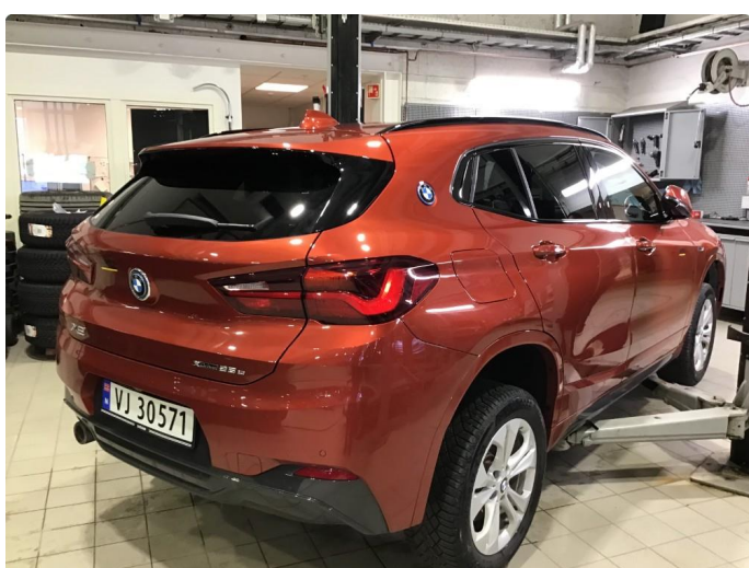
1.1 Oversiktsbilde av bilen.