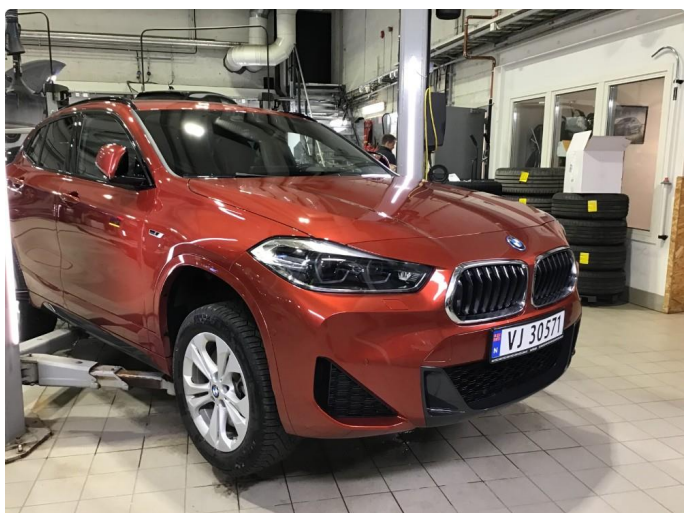
1.1 Oversiktsbilde av bilen.