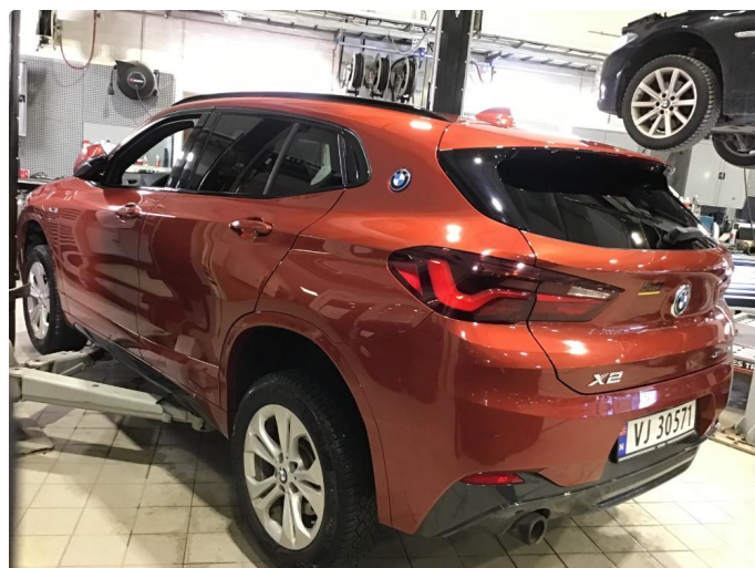
1.1 Oversiktsbilde av bilen.