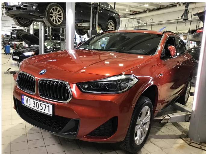
1.1 Oversiktsbilde av bilen.