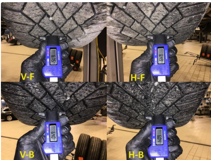
1.3 Mønsterdybde vinterdekk målt ved takst 27.03.24, 36.191km.

Fordon BMW X2 xDrive25e, 162kW WBAYN9106P5V56346