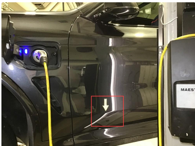
1.1 Liten ripe på førerdør, poleres.