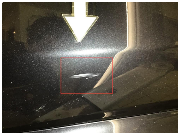
1.1 Liten ripe på førerdør, poleres.