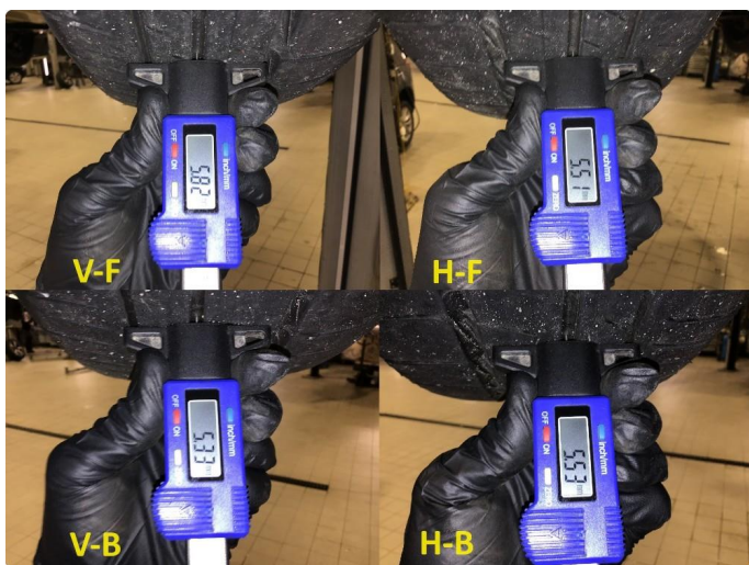
1.5 Dekkdybdemåling sommerdekk , utført 22.07.2024 på km : 45406 .