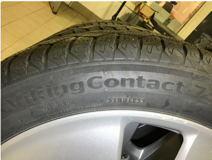
1.2 Vinterdekk produsert 24/2019 Continental Viking Contact 7 155/70R 19 88T Piggfri.