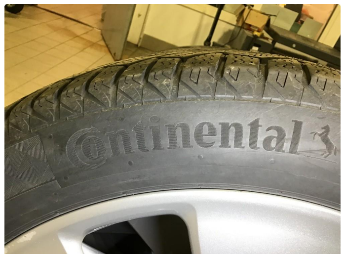
1.2 Vinterdekk produsert 24/2019 Continental Viking Contact 7 155/70R 19 88T Piggfri.