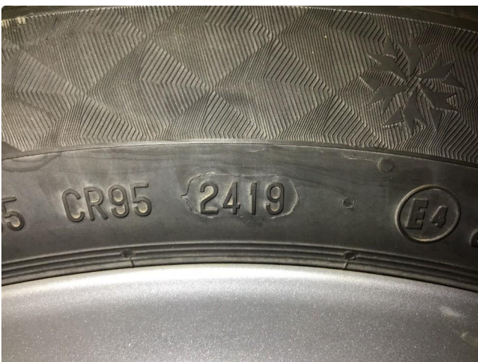
1.2 Vinterdekk produsert 24/2019 Continental Viking Contact 7 155/70R 19 88T Piggfri.