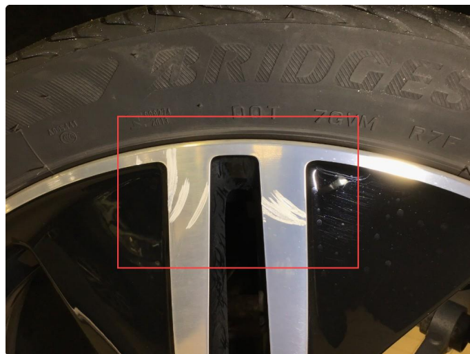
1.3 Noe sår sommerfelg h-fram , normal bruksslitasje .