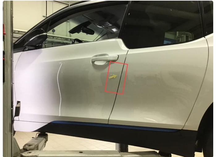
1.1 Lakksår bakre del v-framdør , er flekket tidligere . Normal bruksslitasje.