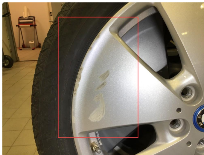
1.4 Noe sår 1 stk vinterfelg , normal bruksslitasje .