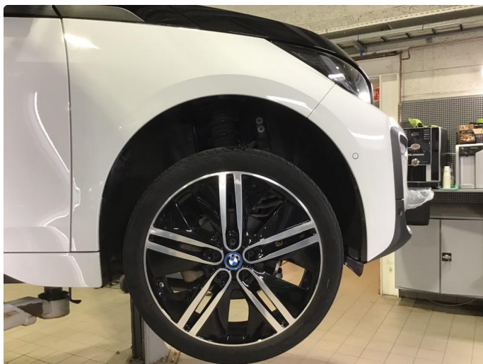
1.3 Noe sår sommerfelg h-fram , normal bruksslitasje .