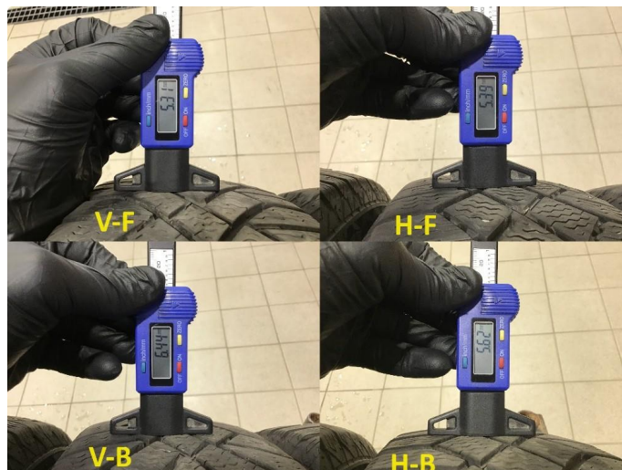
1.6 Dekkdybdemåling vinterdekk , utført 22.07.2024 på km : 45406 .