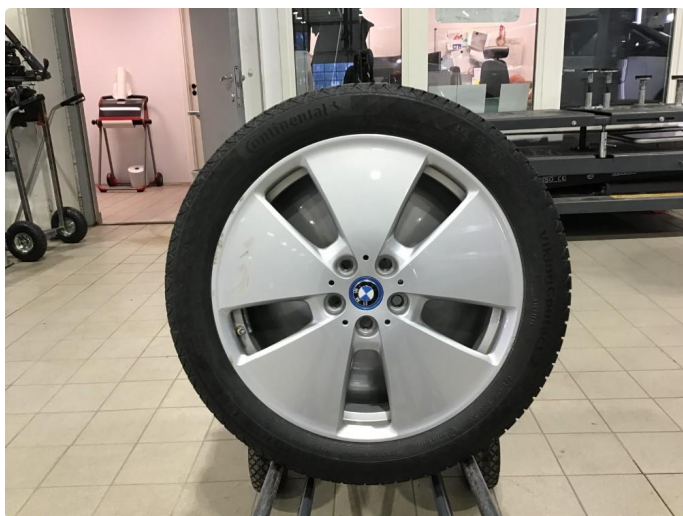
1.4 Noe sår 1 stk vinterfelg , normal bruksslitasje .