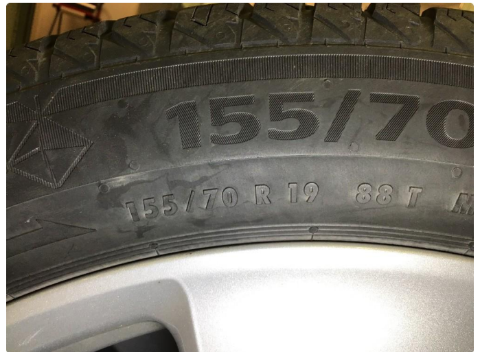
1.2 Vinterdekk produsert 24/2019 Continental Viking Contact 7 155/70R 19 88T Piggfri.