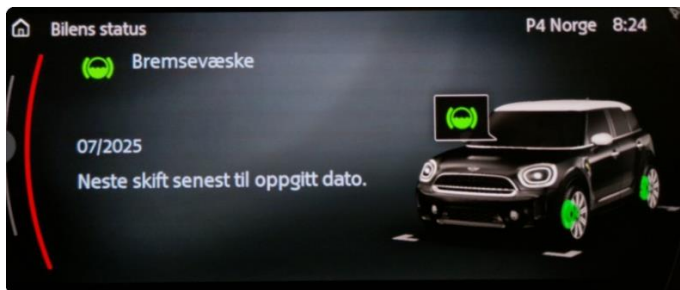
2.1 Neste service 07/2025.