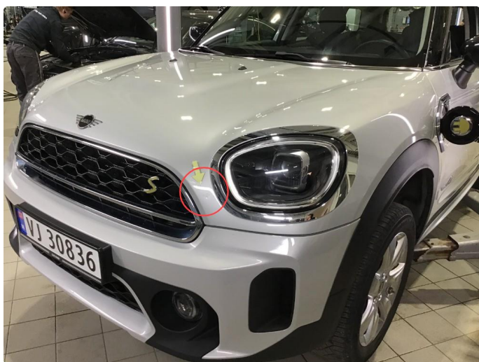
1.2 Noe steinsprut på panser.