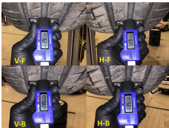
1.3 Mønsterdybde sommerdekk målt ved takst 25.04.24, 39.148km.