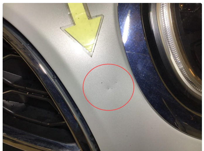
1.2 Noe steinsprut på panser.