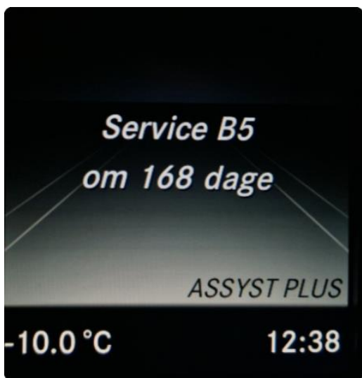
2.1 Neste service om 168 dager regnet fra takstdato 07.12.23.