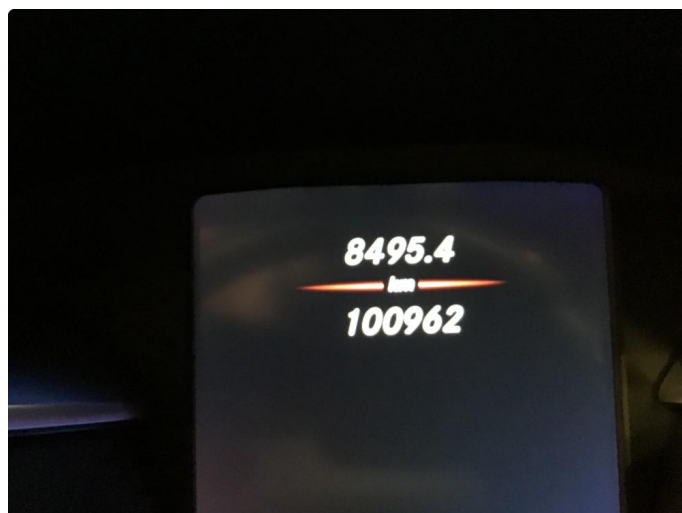
1.1 Oversiktsbilder av bilen.