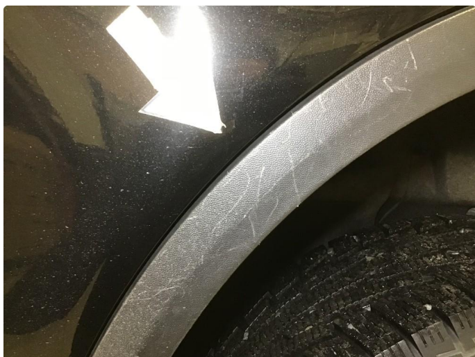
1.3 Noen bruksmerker skjermutbygger, regnes som normal bruksslitasje.