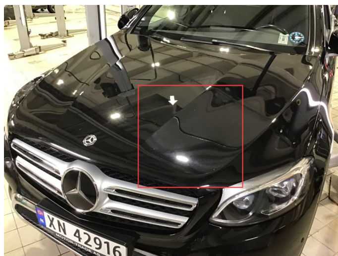
1.2 Noe steinsprut på panser og frontfanger.