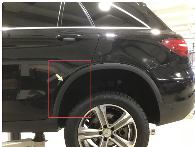
1.3 Noen bruksmerker skjermutbygger, regnes som normal bruksslitasje.