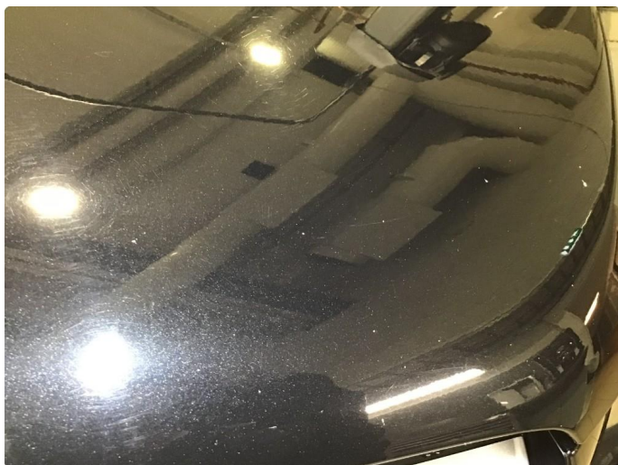
1.2 Noe steinsprut på panser og frontfanger.