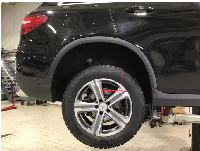
1.7 Noen bruksmerker på 1 vinterfelg.