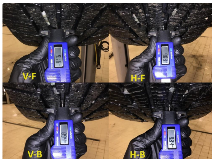
1.6 Mønsterdybde vinterdekk målt ved takst 07.12.23, 100.962km.