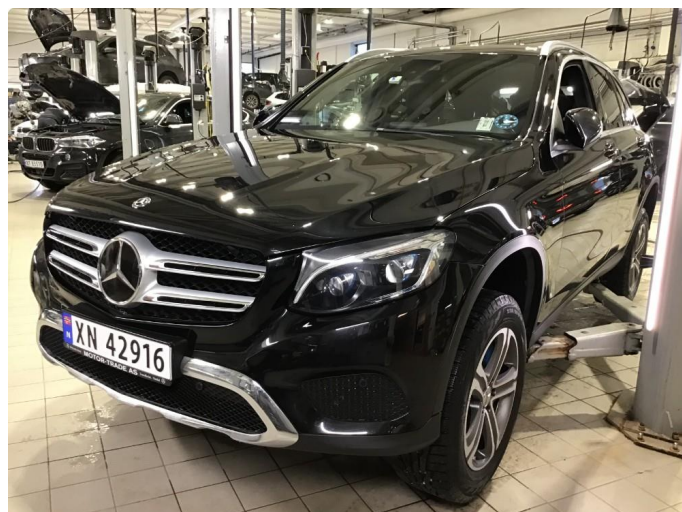
1.1 Oversiktsbilder av bilen.