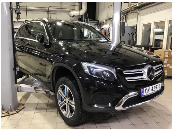
1.1 Oversiktsbilder av bilen.