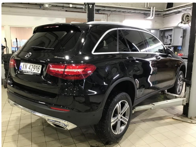
1.1 Oversiktsbilder av bilen.