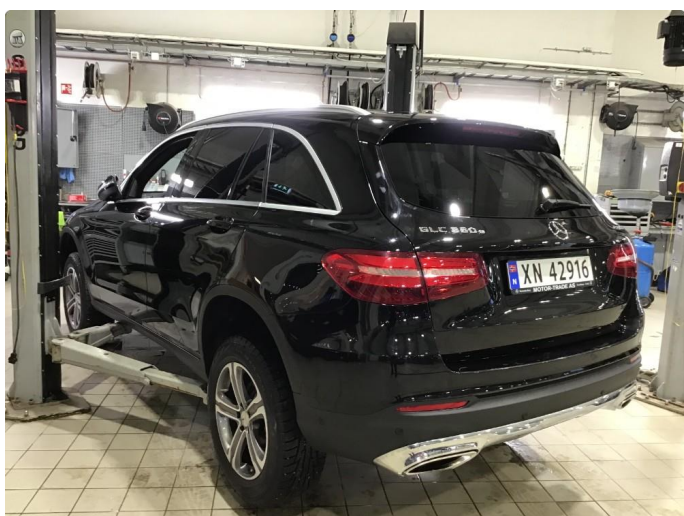
1.1 Oversiktsbilder av bilen.