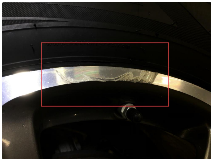
1.7 Noen bruksmerker på 1 vinterfelg.