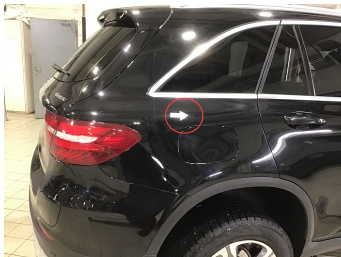
1.4 Liten p-bulk h-bakskjerm.