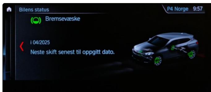
2.1 Neste service 04/2025. Bile har en aktiv serviceavtale til bilen er 3 år eller har gått 60.000km, hva som først inntreffer.

Fordon BMW X2 xDrive25e, 162kW WBAK1G106F5V34234