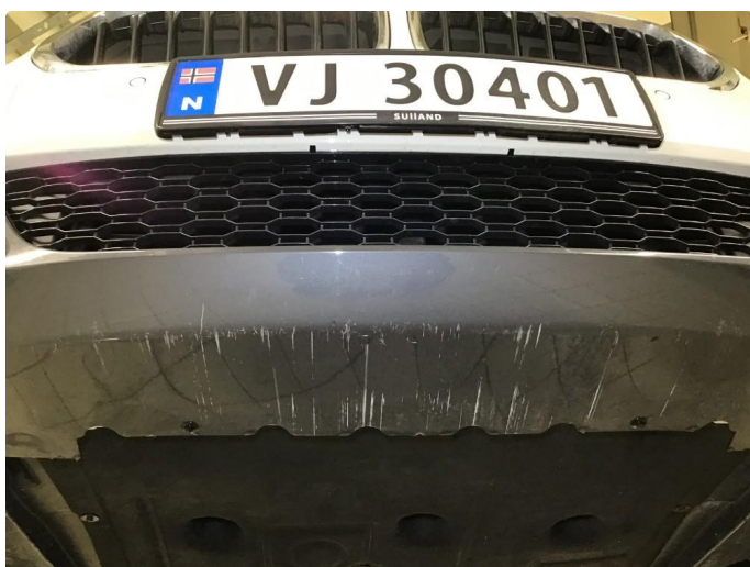
1.5 Noen skrubbermerker underkant framfanger, regnes som normal bruksslitasje.