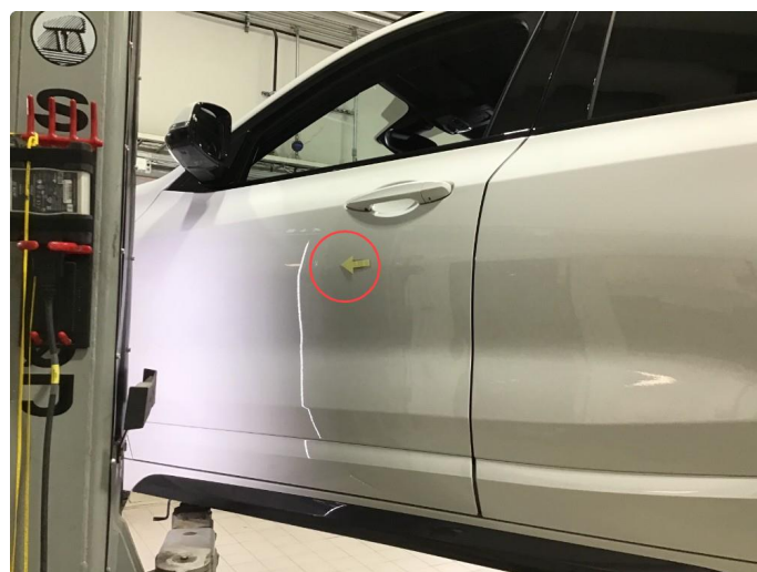
1.2 Liten p-bulk v- framdør, regnes som normal bruksslitasje.