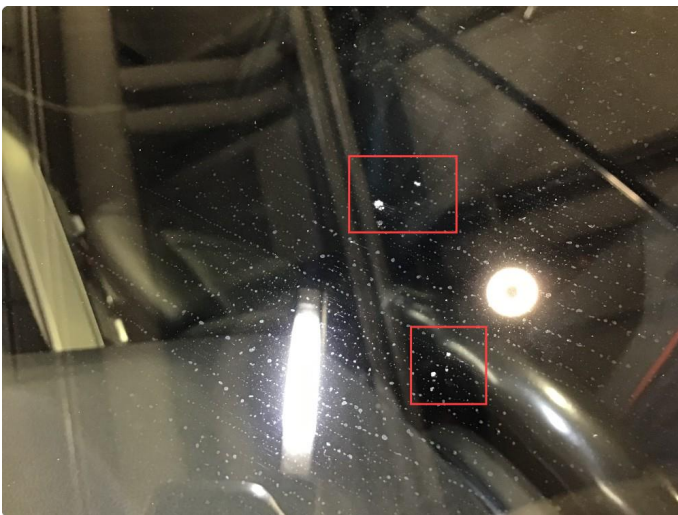
1.3 Noe steinsprut på frontrute, for små til å repareres.