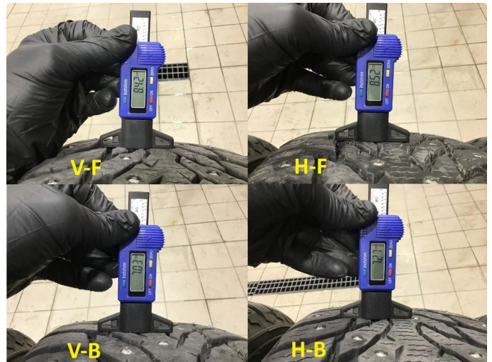
1.2 Mønsterdybde vinterdekk målt ved takst 03.09.2024 44.505km