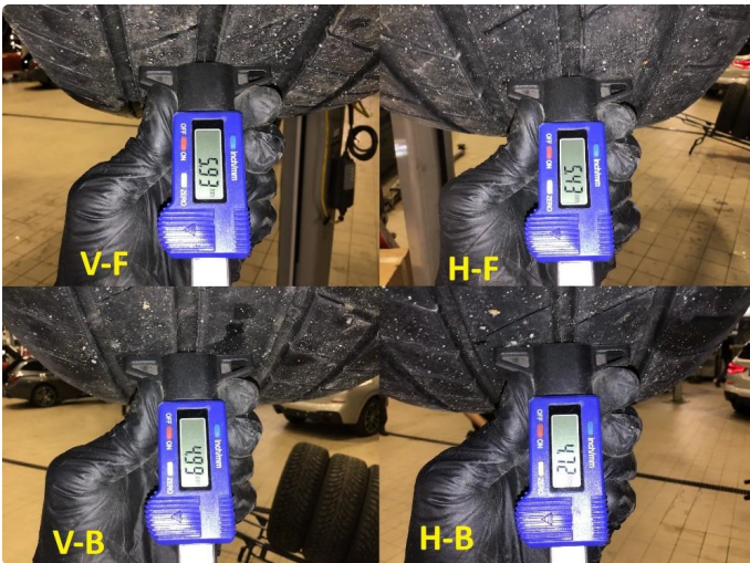
1.1 Mønsterdybde sommerdekk målt ved takst 03.09.2024 44.505km. Nye dekk påsatt etter takst.