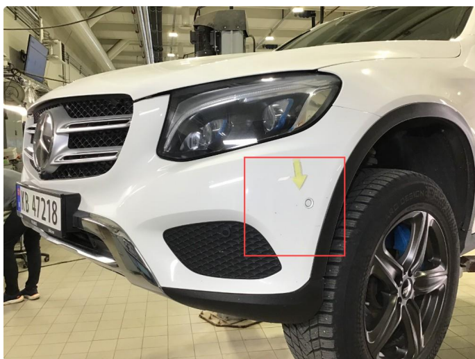
1.3 Noen bruksmerker på frontfanger, regnes som normal bruksslitasje.