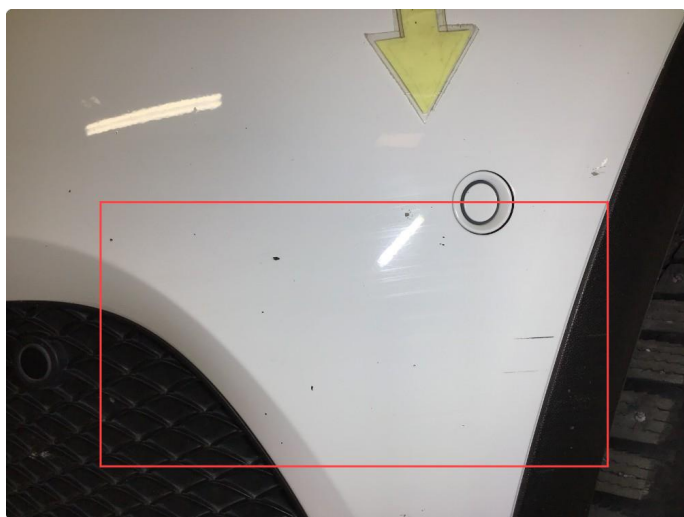
1.3 Noen bruksmerker på frontfanger, regnes som normal bruksslitasje.