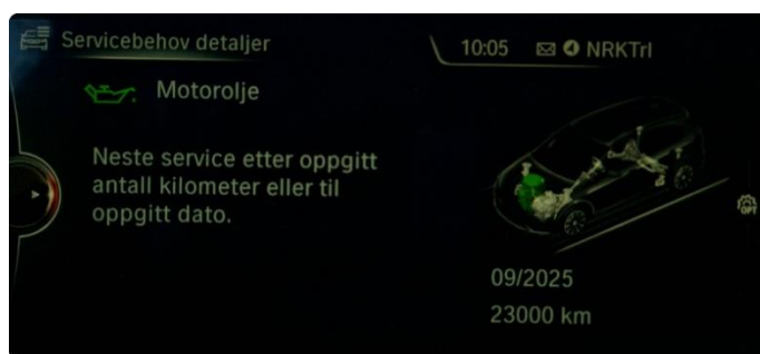
2.1 Neste service 09.2025/ 23.000km.