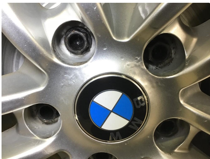
1.3 Noe korrodreing på vinterfelger.