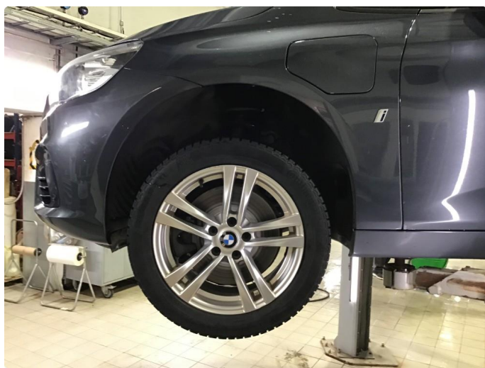
1.3 Noe korrodreing på vinterfelger.