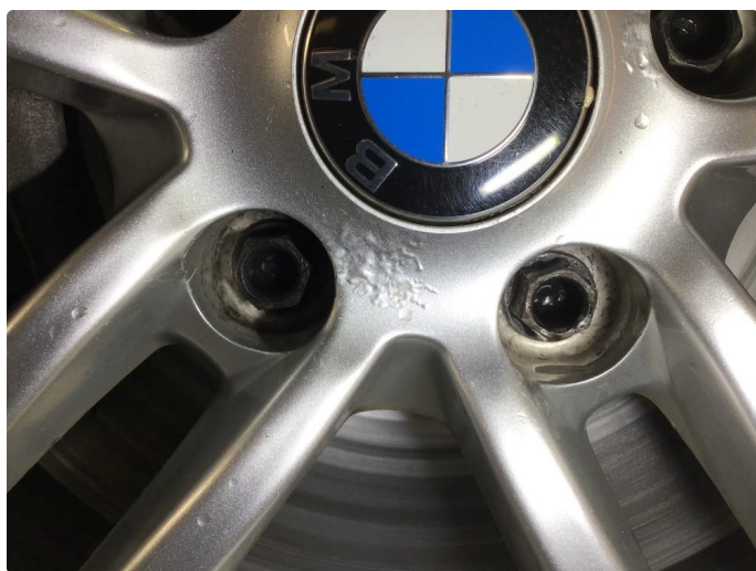
1.3 Noe korrodreing på vinterfelger.