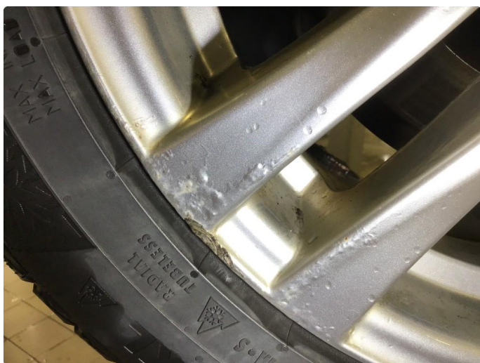
1.3 Noe korrodreing på vinterfelger.