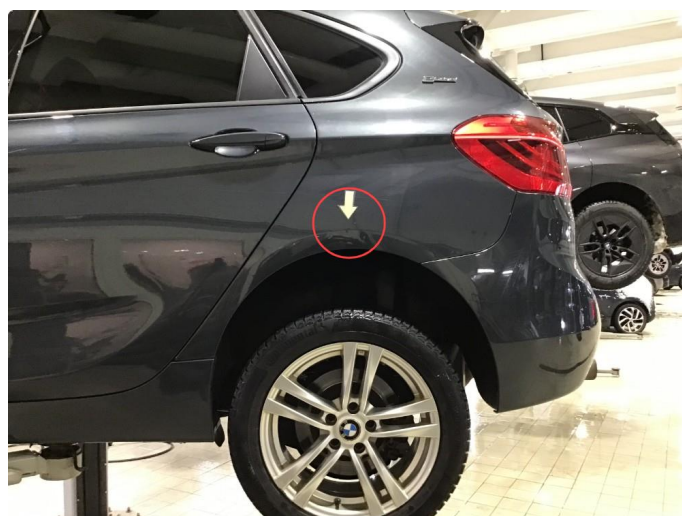
1.2 Liten p-bulk v-bakskjerm ( Normal bruksslitasje )