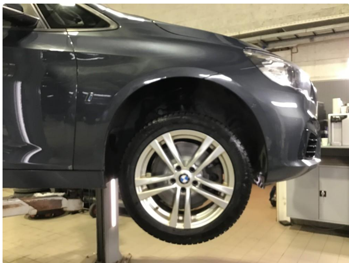
1.3 Noe korrodreing på vinterfelger.