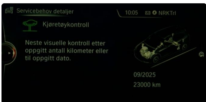
2.1 Neste service 09.2025/ 23.000km.