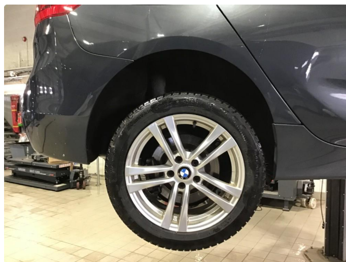
1.3 Noe korrodreing på vinterfelger.