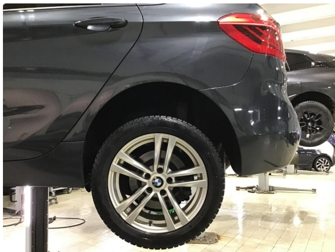
1.3 Noe korrodreing på vinterfelger.