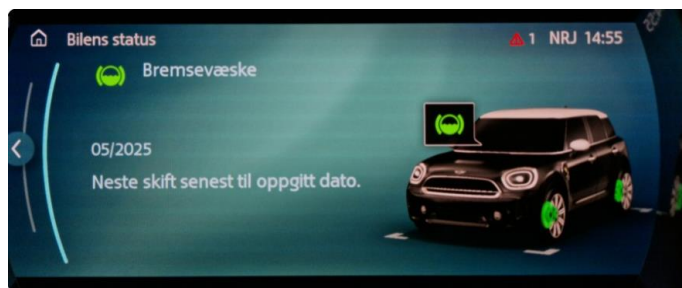
2.1 Neste service 05/2025. Bilen har en aktive serviceavtale til bilen er 3 år eller har gått 60.000km, hva som først inntreffer.

Fordon MINI MINI Cooper SE ALL4 Countryman, 165kW WMWZ1B50ZFP39553