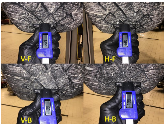
1.3 Mønsterdybde vinterdekk målt ved takst 15.02.24, 38.648km.