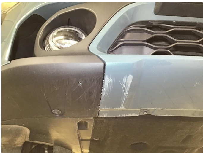
1.4 Noe skrubbermerker underkant fremfanger, regnes som normal bruksslitasje.