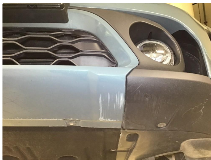
1.4 Noe skrubbermerker underkant fremfanger, regnes som normal bruksslitasje.