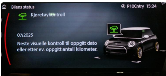
2.1 Neste service 07/2025.