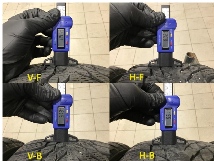
1.2 Mønsterdybde vinterdekk målt ved takst 18.07.2024, 29.857km.