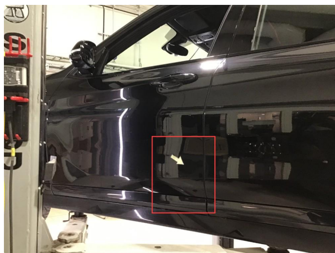
1.3 Langsgående riper på v-fremdør + trolig opplakkert før. Vi har lakkert døren på nytt pga ripene før salg.