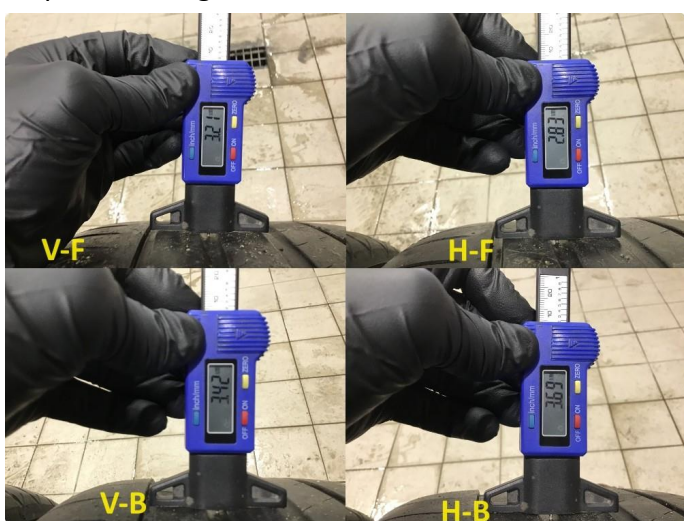
1.4 Mønsterdybde sommerdekk målt ved takst 04.12.24, 38.119km.