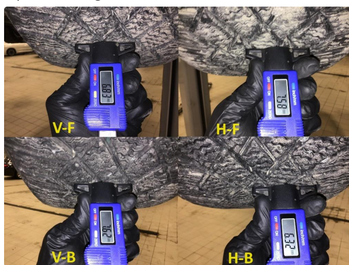
1.5 Mønsterdybde vinterdekk målt ved takst 04.12.24, 38.119km.