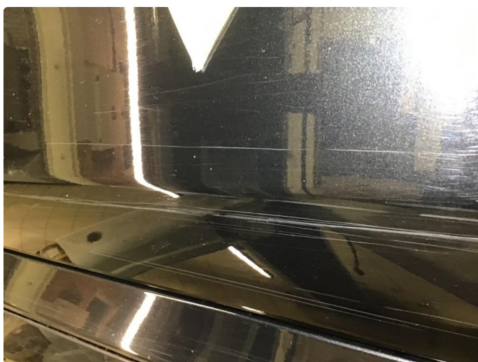
1.3 Langsgående riper på v-fremdør + trolig opplakkert før. Vi har lakkert døren på nytt pga ripene før salg.