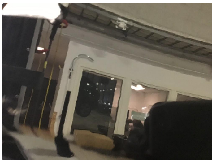
1.3 Langsgående riper på v-fremdør + trolig opplakkert før. Vi har lakkert døren på nytt pga ripene før salg.