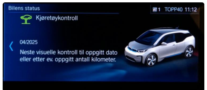
2.1 Neste service 04/2025 . Bilen har serviceavtale til bilen er 4år