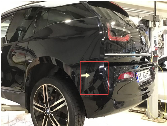
1.1 Bruksmerker bakskjerm , poleres.