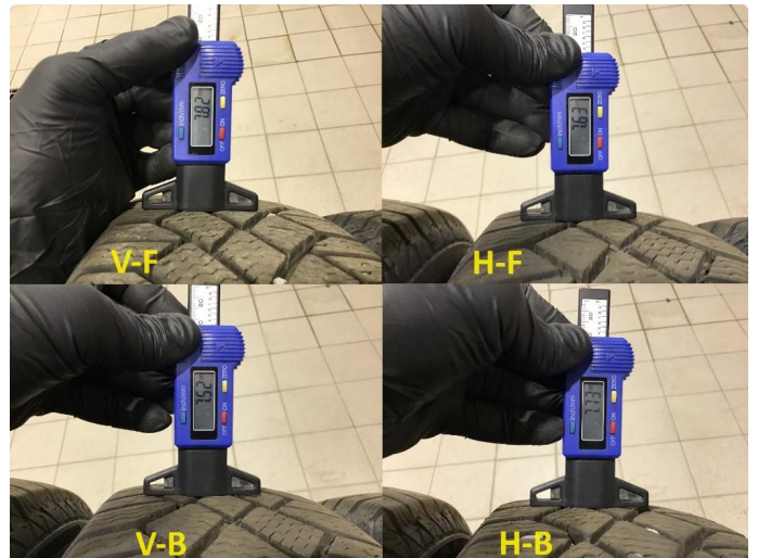
1.3 Mønsterdybde vinterdekk , målt ved takst 28.06.24 , 14150km.