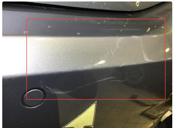
1.4 Noen riper bakfanger h-side + innlastingszone . Normal bruksslitasje.