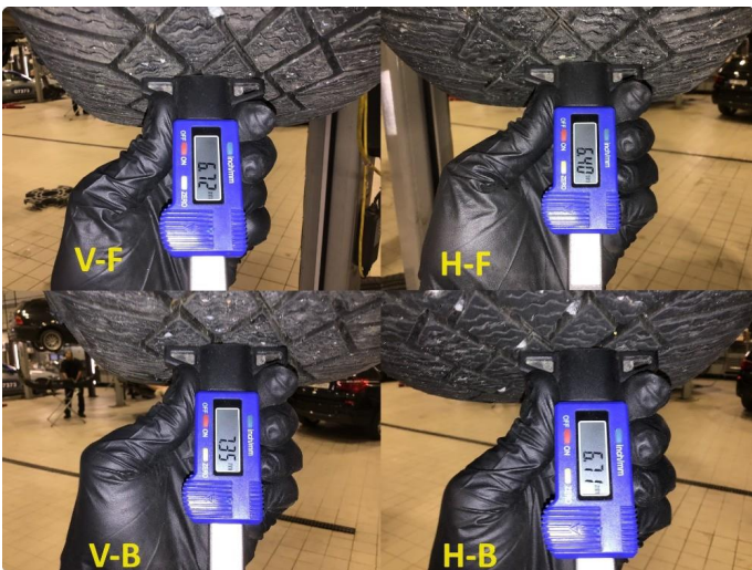
1.3 Dekkdybdemåling vinterdekk , utført 24.05.2024 på km : 35699 .