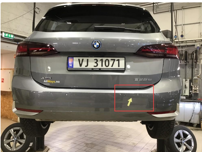
1.4 Noen riper bakfanger h-side + innlastingszone . Normal bruksslitasje.