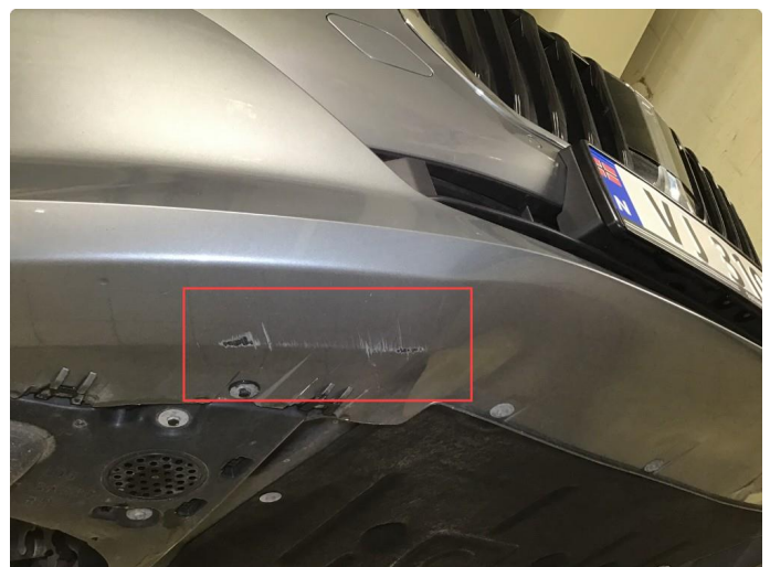
1.5 Noe skrubbskader underkant frontfanger. Normal bruksslitasje.