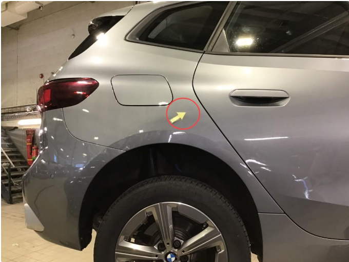
1.1 Liten p-bulk bakskjerm h-side , normal bruksslitasje.