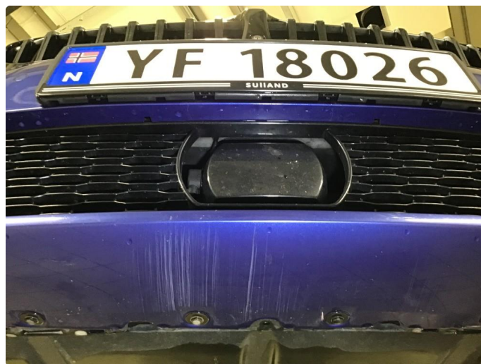
1.4 Noen skrubbermerker underkant fremfanger, regnes som normal bruksslitasje.