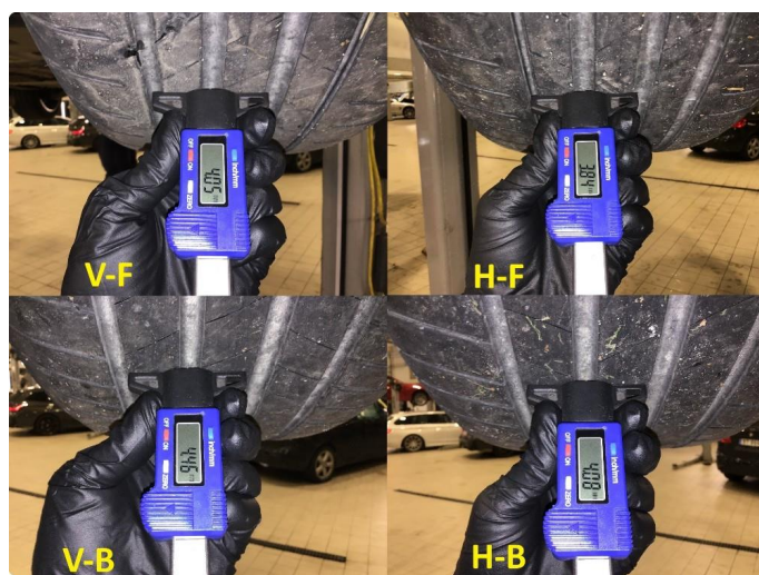
1.3 Mønsterdybde sommerdekk målt ved takst 20.09.2024, 36.849km.