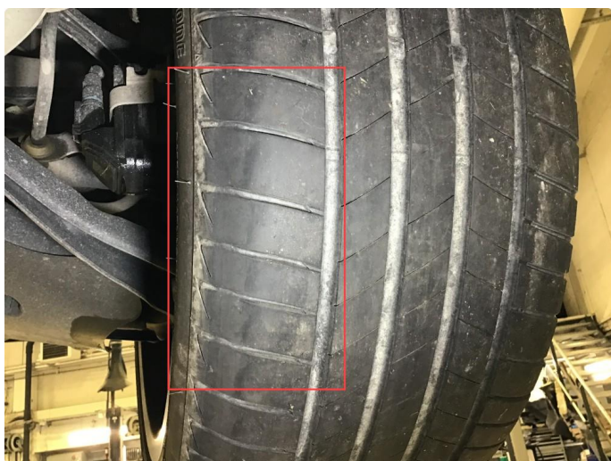
1.2 Noe skjev slitasje på sommerdekk, regnes som normalt.