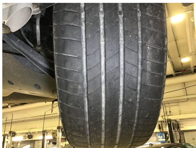
1.2 Noe skjev slitasje på sommerdekk, regnes som normalt.