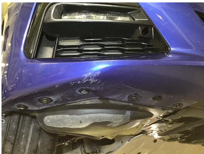
1.4 Noen skrubbermerker underkant fremfanger, regnes som normal bruksslitasje.