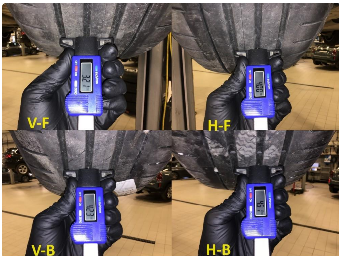
2.2 Mønsterdybde sommerdekk målt ved takst 18.04.24, 44.889km.