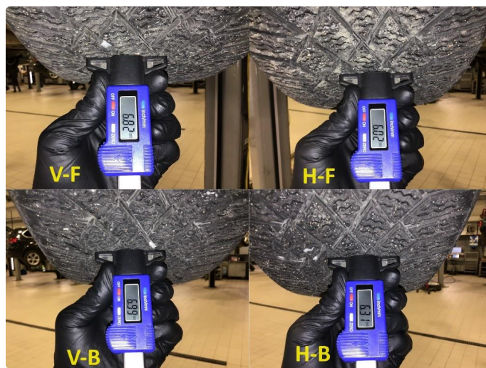
2.3 Mønsterdybde vinterdekk målt ved takst 18.04.24, 44.889km.