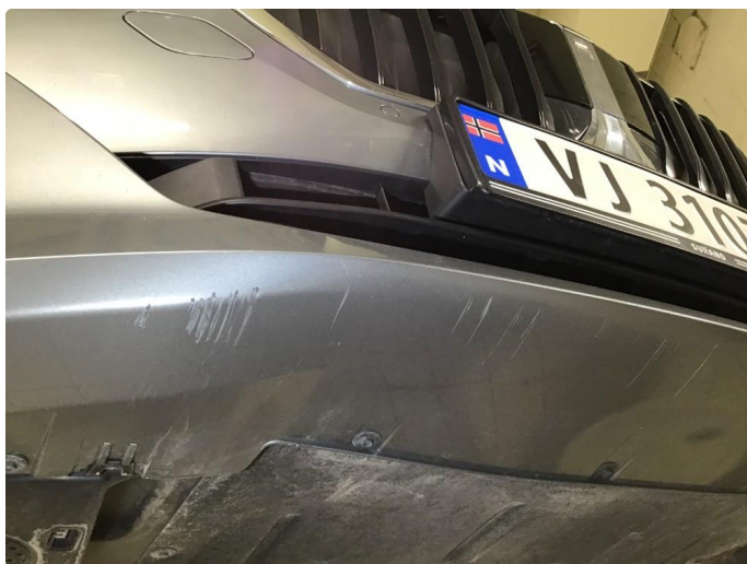
2.4 Noen skrubbermerker underkant fremfanger, regnes som normal bruksslitasje.