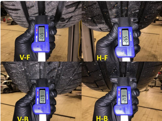
1.2 Mønsterdybde sommerdekk målt ved takst 24.10.2024, 54.499km.