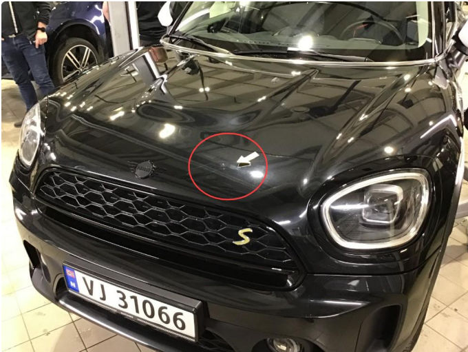
1.1 Noen småbulker på panser.