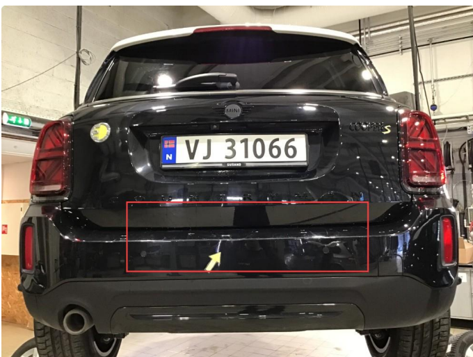
1.4 Noen bruksmerker på bakfanger, poleres.