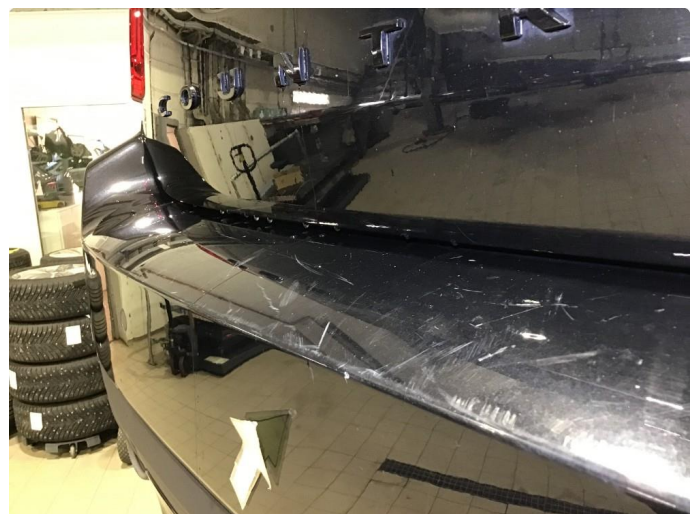
1.4 Noen bruksmerker på bakfanger, poleres.