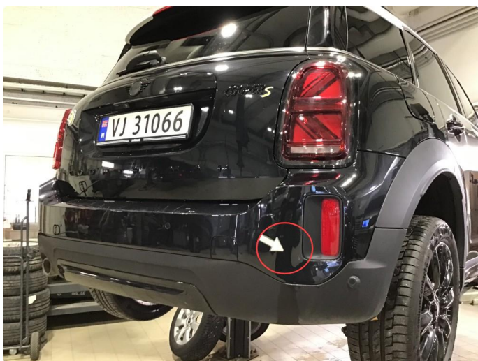
1.4 Noen bruksmerker på bakfanger, poleres.