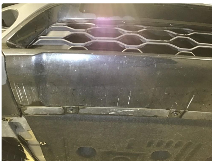
1.5 Skrubbermerker underkant fremfanger, regnes som normal bruksslitasje.