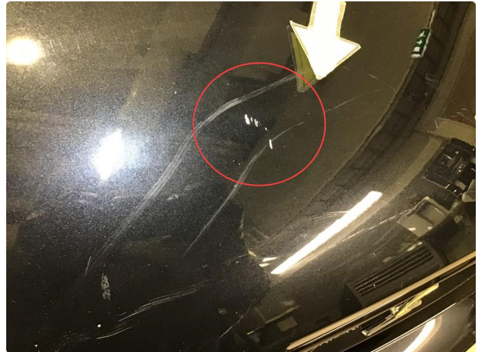
1.1 Noen småbulker på panser.