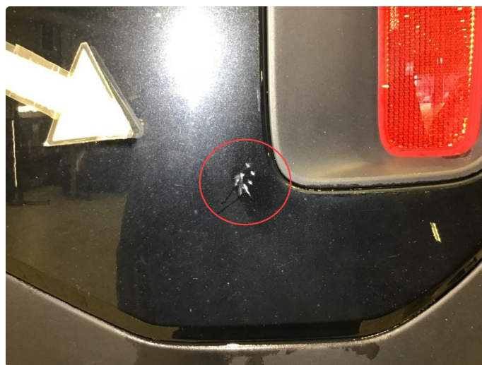
1.4 Noen bruksmerker på bakfanger, poleres.