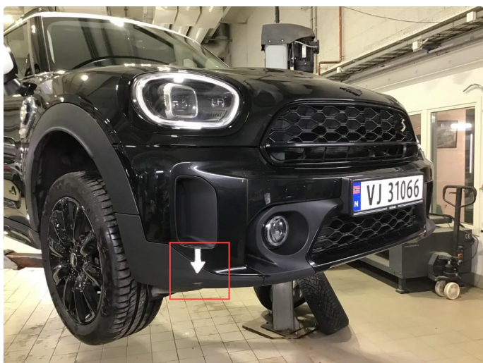
1.5 Skrubbermerker underkant fremfanger, regnes som normal bruksslitasje.