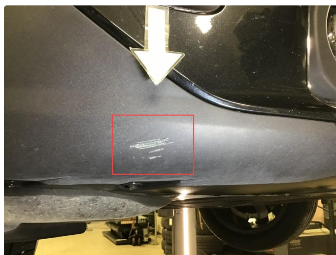
1.5 Skrubbermerker underkant fremfanger, regnes som normal bruksslitasje.