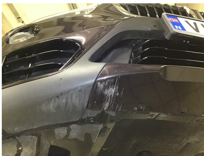
1.6 Noen skrubbermerker underkant fremfanger, regnes som normal bruks slitasje.