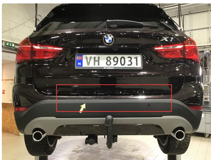
1.7 Noen bruksmerker på innlastingszone bakfanger, poleres.