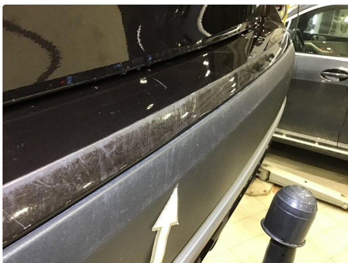
1.7 Noen bruksmerker på innlastingssone bakfanger, poleres.