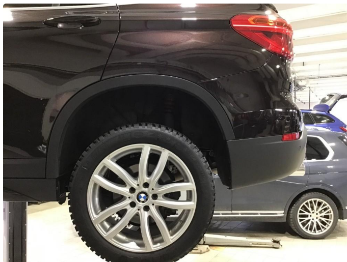
1.3 Noen bruksmerker/korrosjon 1 vinterfelg.