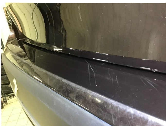
1.7 Noen bruksmerker på innlastingszone bakfanger, poleres.