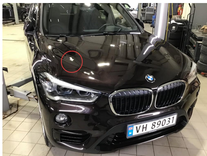
1.2 Liten bulk h-side panser, regnes som normal bruksslitasje.