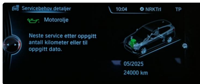
2.1 Neste service 05.2025/24.000km. Bilen har en aktiv serviceavtale til bilen er 7 år eller har gått 100.000km, hva som først inntreffer.