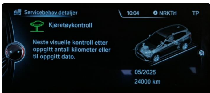
2.1 Neste service 05.2025/24.000km. Bilen har en aktiv serviceavtale til bilen er 7 år eller har gått 100.000km, hva som først inntreffer.