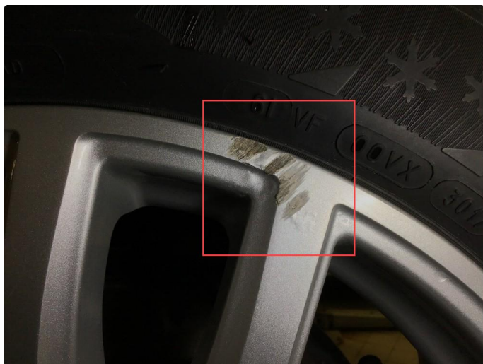
1.3 Noen bruksmerker/korrosjon 1 vinterfelg.