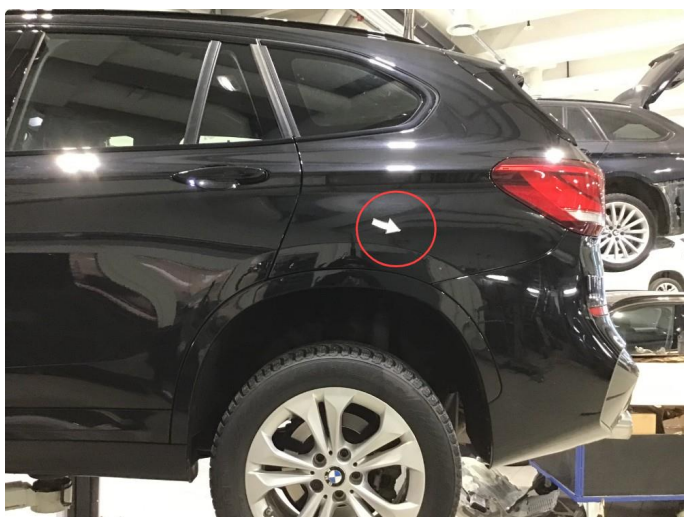
1.3 Liten p-bulk v-bakskjerm, regnes som normal bruksslitasje.