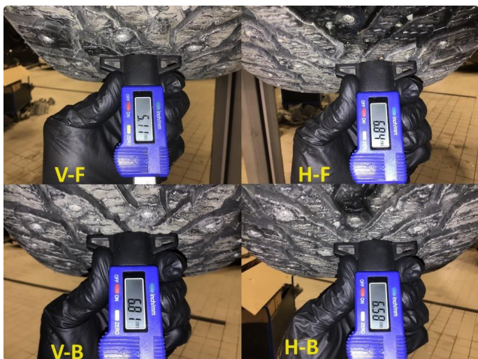
1.5 Mønsterdybde vinterdekk målt ved takst 15.11.23, 48.332km.