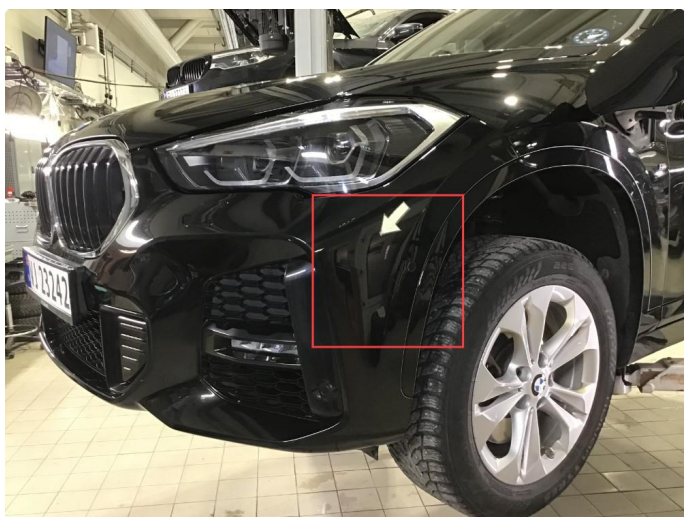
1.8 Noen riper v-framskjerm, poleres.