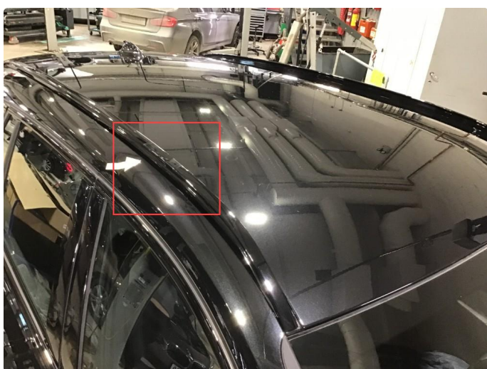
1.6 Noen merker etter takstativ eller lignende, normal bruksslitasje.