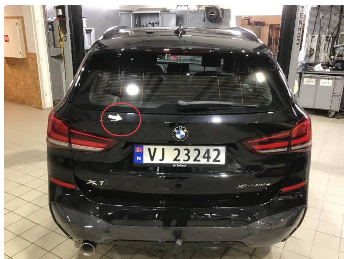
1.2 Liten bulk øvre del bakluge, normal bruksslitasje.