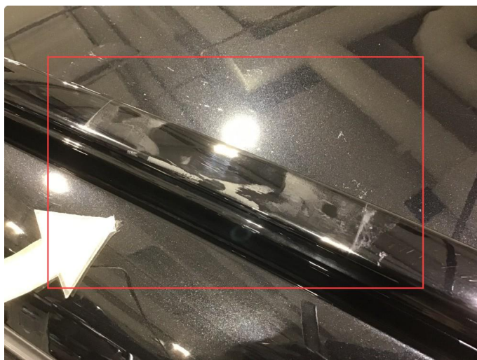
1.6 Noen merker etter takstativ eller lignende, normal bruksslitasje.