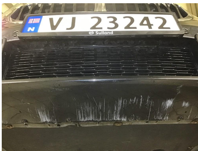
1.7 Noen skrubbermerker underkant fremfanger, regnes som normal bruksslitasje.