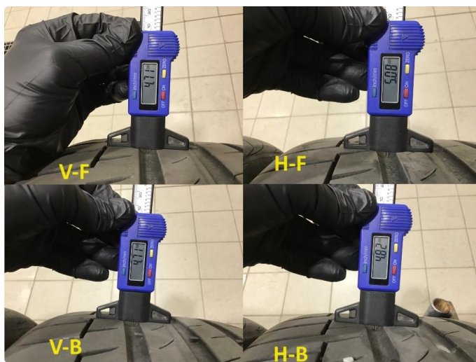
1.4 Mønsterdybde sommerdekk målt ved takst 15.11.23, 48.332km.