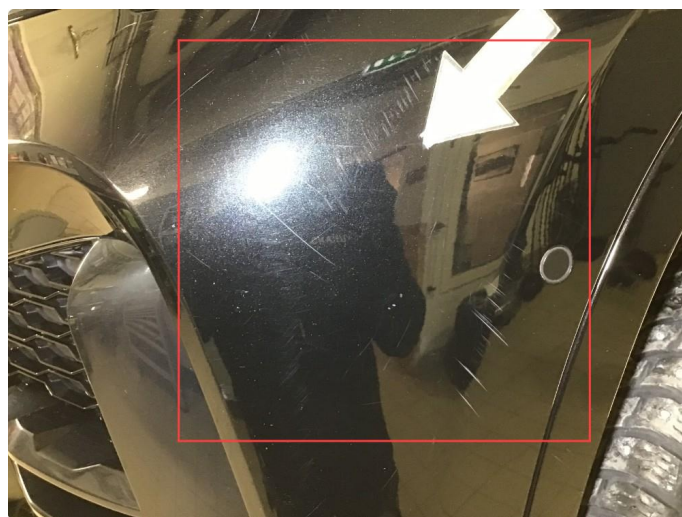
1.8 Noen riper v-framskjerm, poleres.