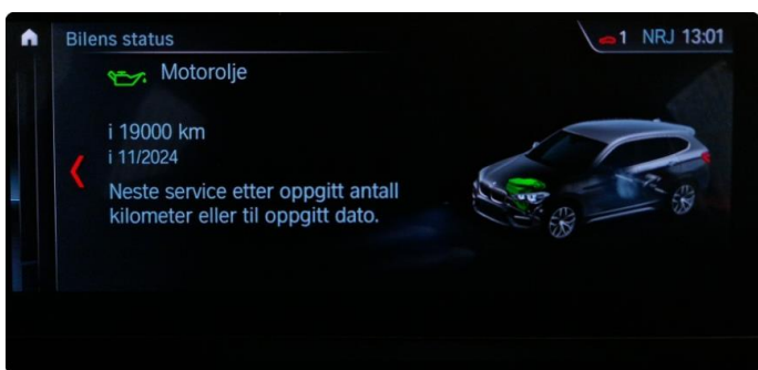
2.1 Neste service 11.2024/19.000km.