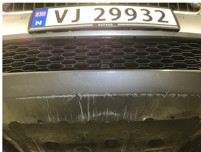
1.4 Noen skrubbermerker underkant fremfanger, regnes som normal bruksslitasje.

Fordon BMW X2 xDrive25e, 162kW WBA1N810XP5V33636