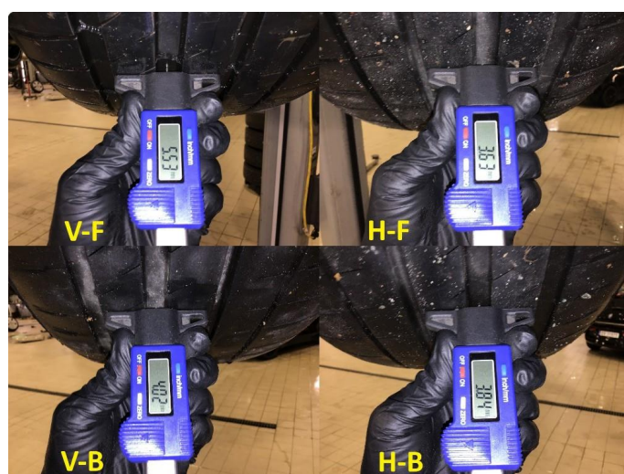
1.2 Mønsterdybde sommerdekk målt ved takst 23.10.2024, 51.500km. 2 Nye sommerdekk bak påsatt etter takst.