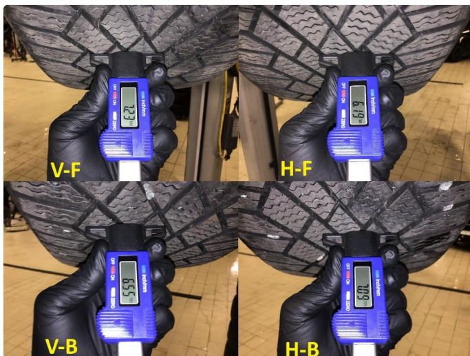
1.3 Mønsterdybde vinterdekk målt ved takst 23.10.2024, 51.500km.