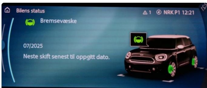
2.1 Neste service 07/2025. Bilen har en aktiv serviceavtale til bilen er 3 år eller har gått 60.000km, hva som først inntreffer.