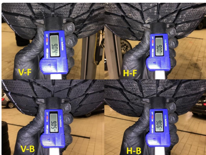
1.3 Mønsterdybde vinterdekk målt ved takst 30.10.2024, 53.215km.