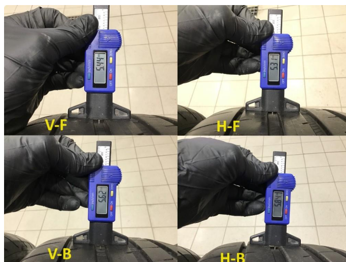
1.2 Mønsterdybde sommerdekk målt ved takst 19.02.24, 33.194km.