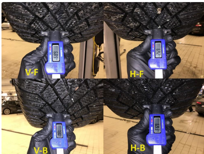
1.3 Mønsterdybde vinterdekk målt ved takst 19.02.24, 33.194km.