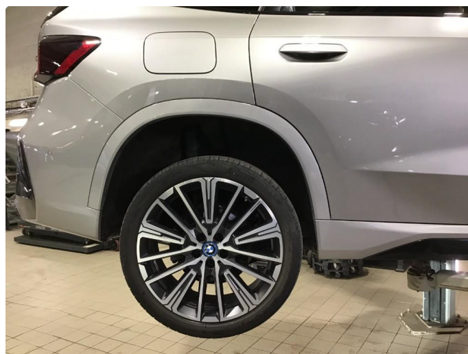
1.2 Bruksmerke på 1 sommerfelg.