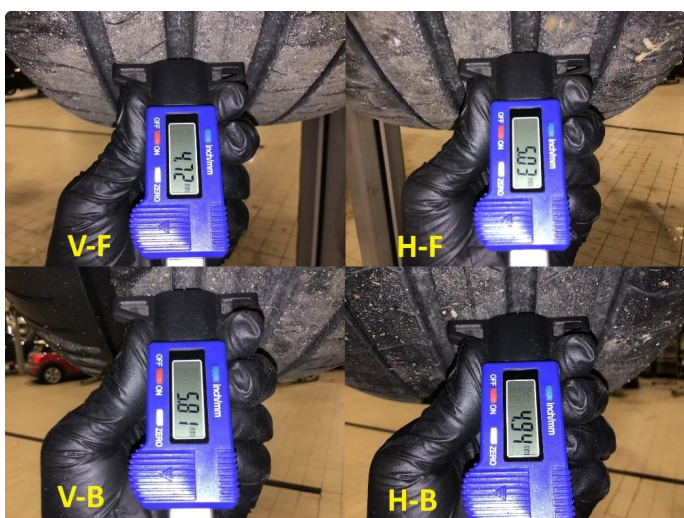
1.3 Mønsterdybde sommerdekk målt ved takst 06.11.2024, 37.469km.