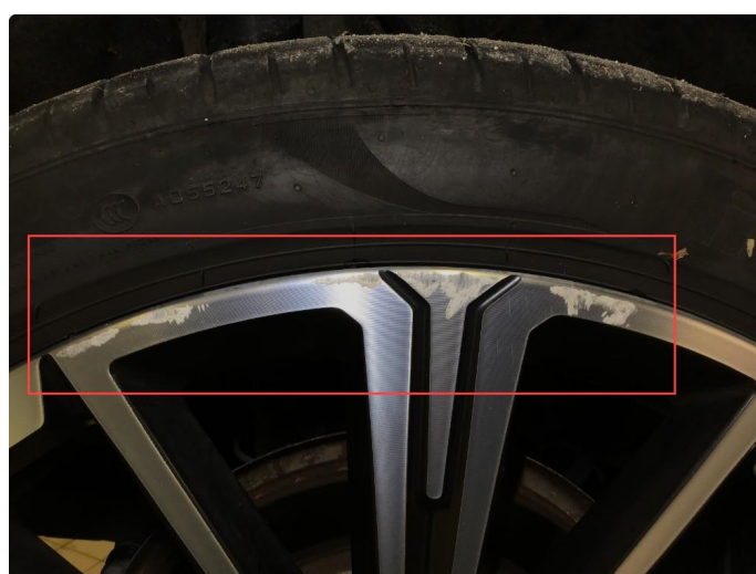
1.2 Bruksmerke på 1 sommerfelg.