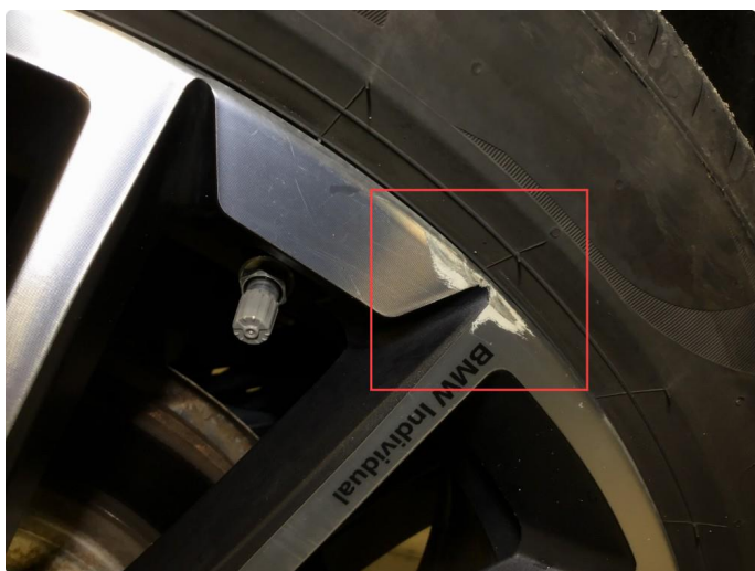
1.2 Bruksmerke på 1 sommerfelg.