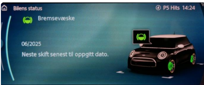
2.1 Neste service 06/2025