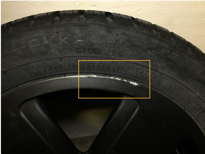
1.1 Bruksmerker på 1 stk vinterfelg, regnes som normal bruksslitasje.