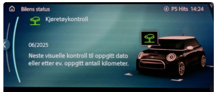
2.1 Neste service 06/2025