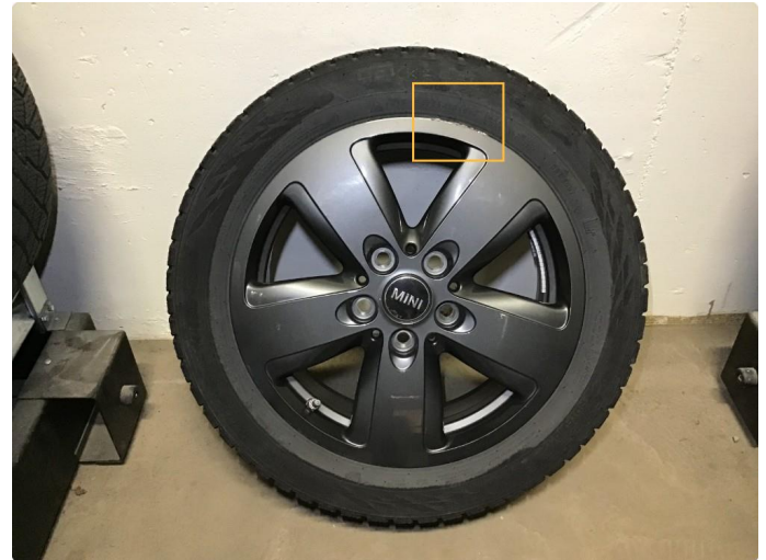
1.1 Bruksmerker på 1 stk vinterfelg, regnes som normal bruksslitasje.