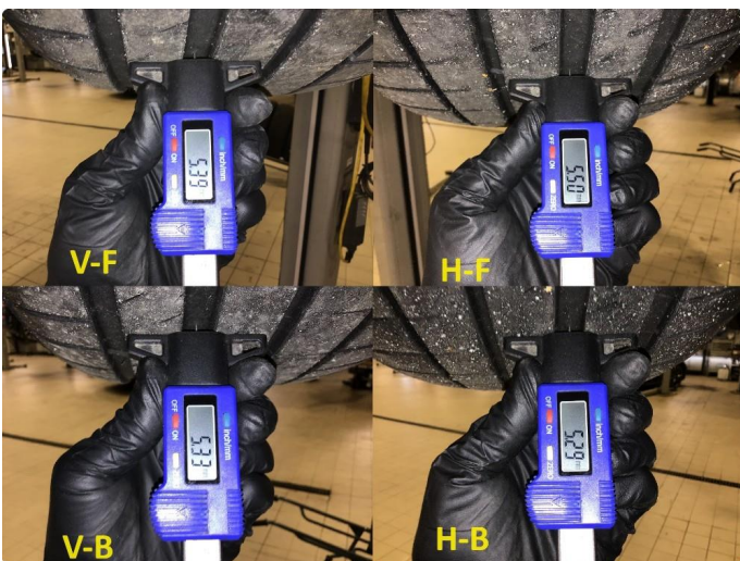
1.2 Mønstedybde sommerdekk målt ved takst 19.07.2024, 22.803km.