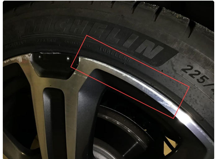
1.1 Noen bruksmerker på 1 sommerfelg.