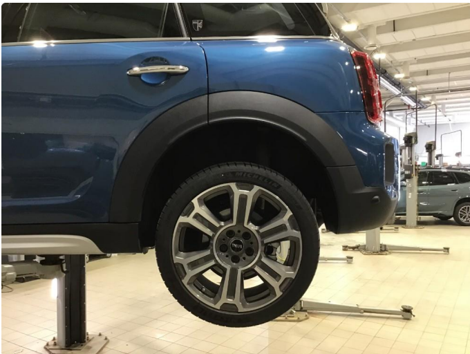
1.1 Noen bruksmerker på 1 sommerfelg.