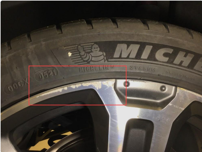
1.1 Noen bruksmerker på 1 sommerfelg.