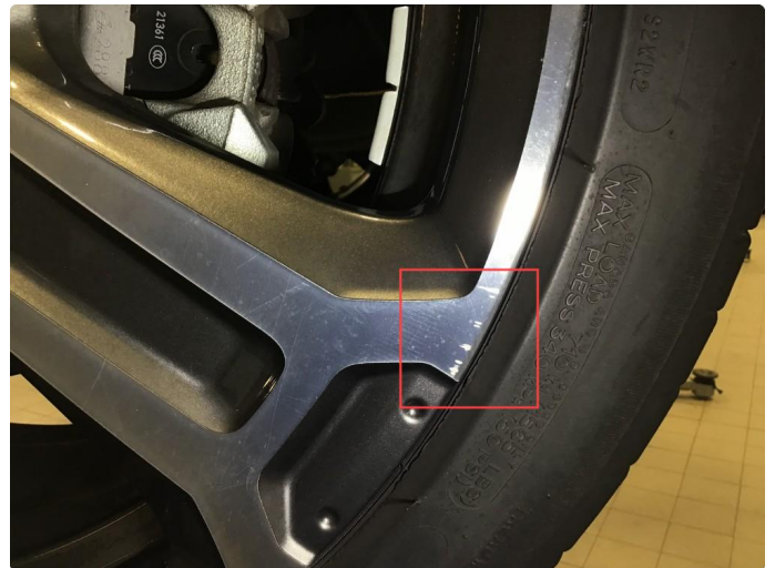
1.1 Noen bruksmerker på 1 sommerfelg.