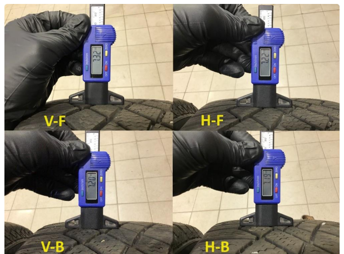
1.3 Mønstedybde vinterdekk målt ved takst 19.07.2024, 22.803km.