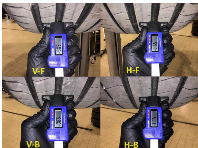
1.1 Mønsterdybde sommerdekk målt ved takst 22.05.24, 43.801km.