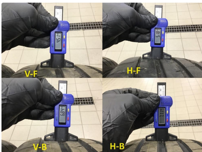
1.3 Mønsterdybde sommerdekk målt ved takst 25.01.24, 39.967km.