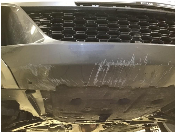
1.5 Noen skrubbermerker underkant fremfanger, regnes som normal bruksslitasje.