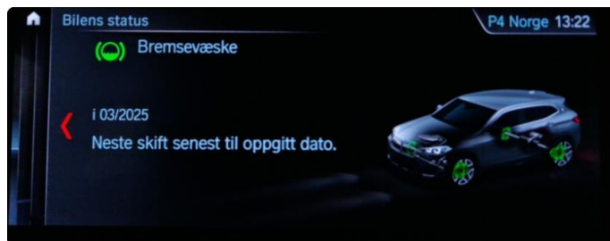
2.1 Neste service 03/2025. Bilen har en aktiv serviceavtale til bilen er 3år eller har gått 60.000km, hva som først inntreffer.