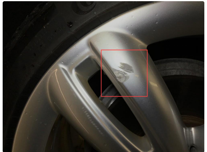
1.2 Noe bruksmerker på 1 vinterfelg.