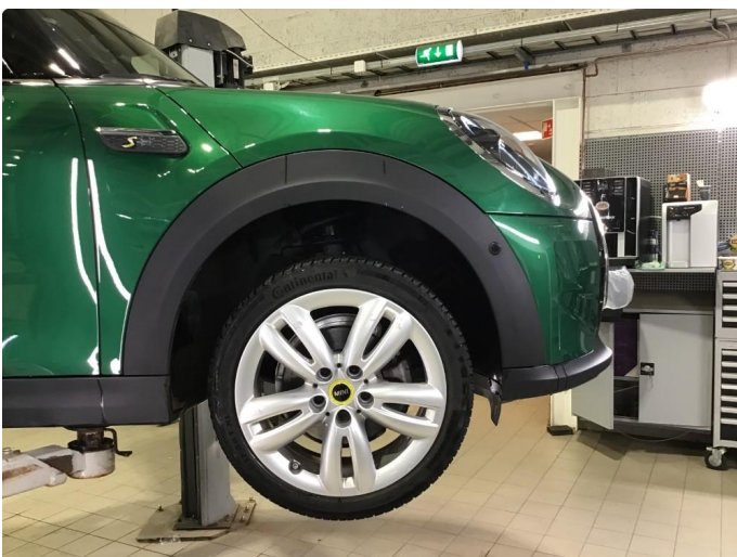
1.2 Noe bruksmerker på 1 vinterfelg.