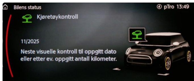
2.1 Neste service 11/2025. Bilen har en aktiv serviceavtale til bilen er 4 år.