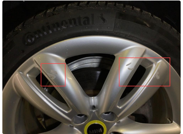
1.2 Noe bruksmerker på 1 vinterfelg.