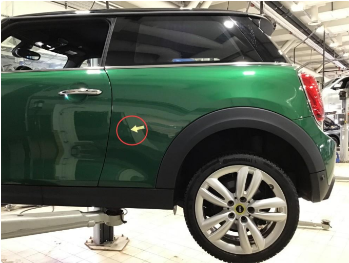
1.1 Liten p-bulk v-bakskjerm ( Normal bruksslitasje )