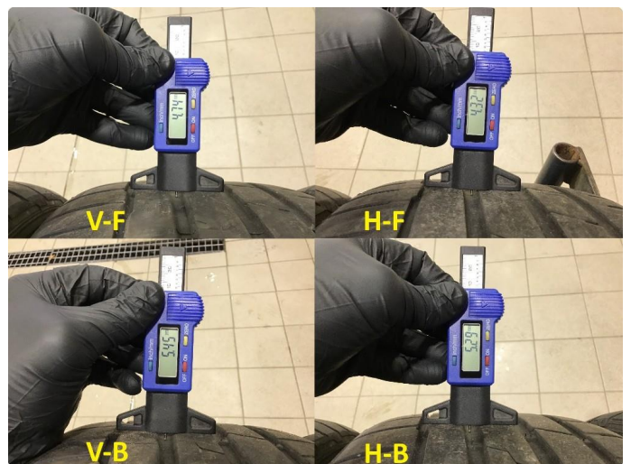
1.3 Mønsterdybde sommerdekk målt ved takst 04.11.2024, 43.366km.