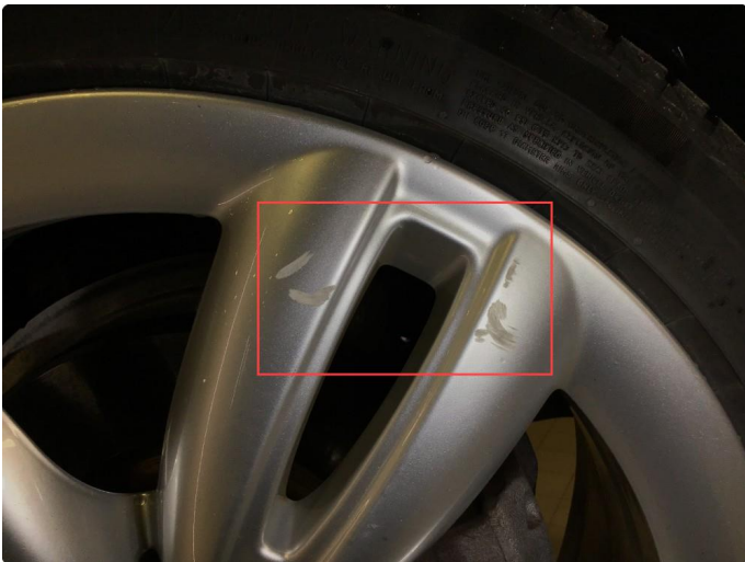
1.2 Noe bruksmerker på 1 vinterfelg.