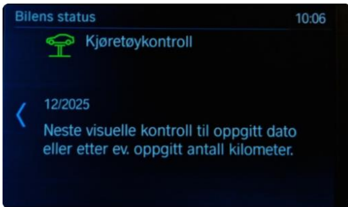
2.1 Neste service 12/2025. Bilen har en aktiv serviceavtale til bilen er 4år.