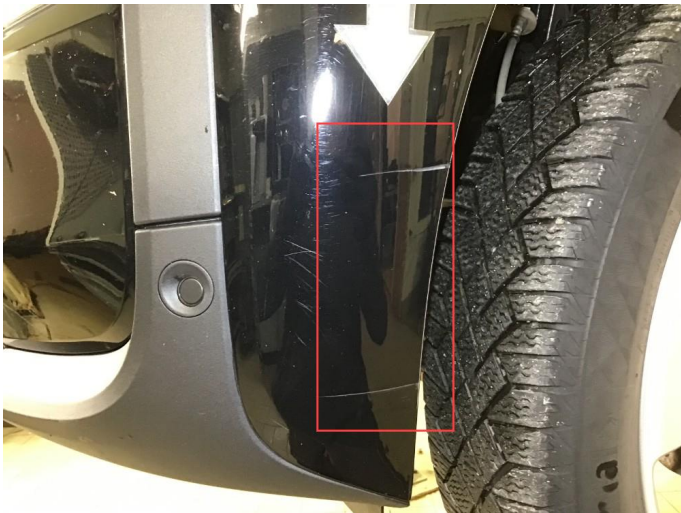
1.1 Noen riper på fremfanger, poleres.