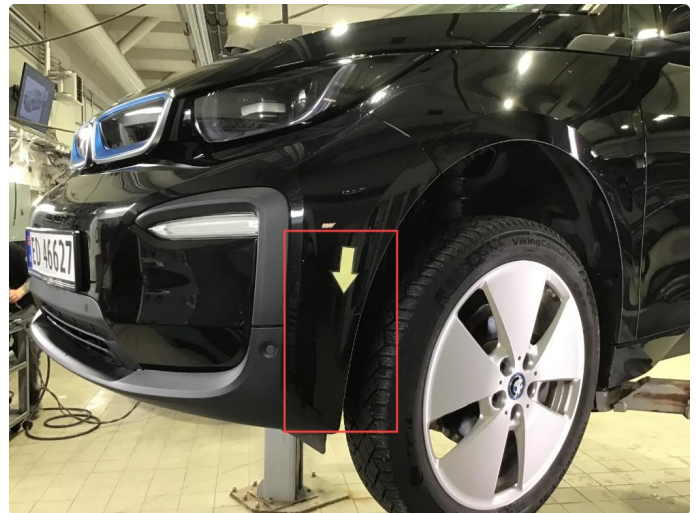
1.1 Noen riper på fremfanger, poleres.