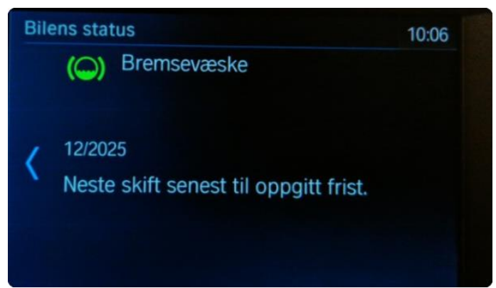
2.1 Neste service 12/2025. Bilen har en aktiv serviceavtale til bilen er 4år.