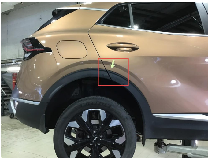
1.2 Noe bruksmerke på skjermutbygger høyre side bak.