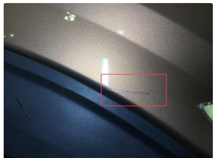
1.2 Noe bruksmerke på skjermtutbygger høyre side bak.