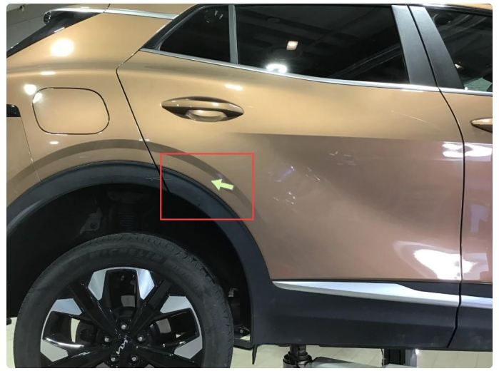
1.2 Noe bruksmerke på skjermutbygger høyre side bak.