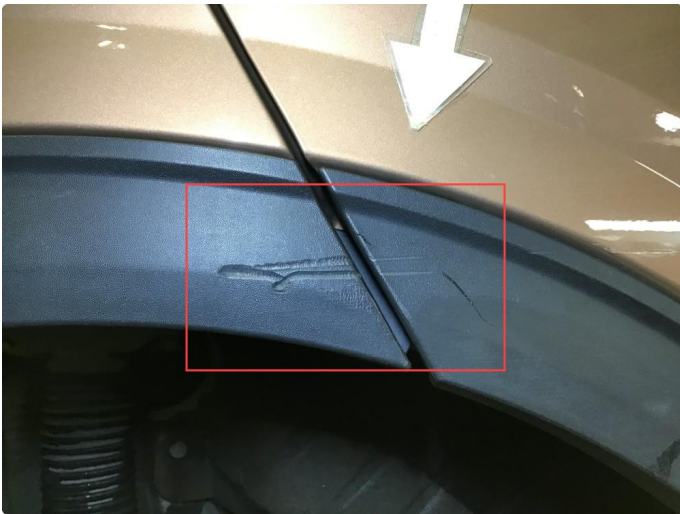
1.2 Noe bruksmerke på skjermutbygger høyre side bak.