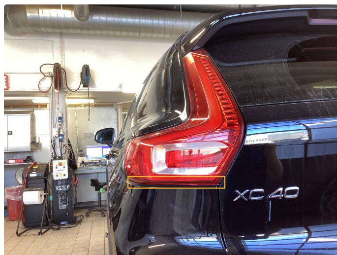
2.1 Krakelering i plast (Repareres)