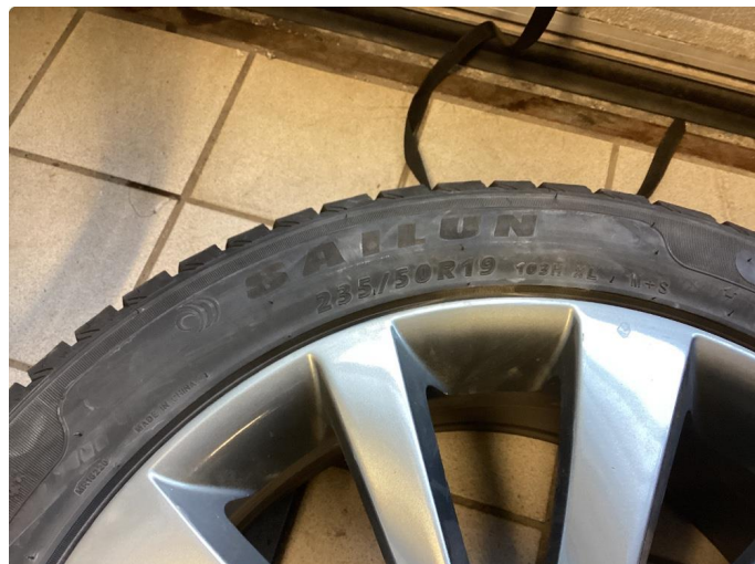
1.2 For lite mønsterdybde vinterdekk 2 stk (Byttes)