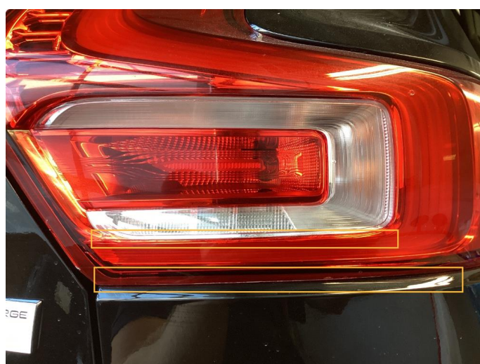
2.1 Krakelering i plast (Repareres)