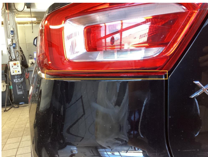
2.1 Krakelering i plast (Repareres)