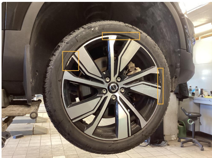
1.1 Kantkjørt felg (Repareres)