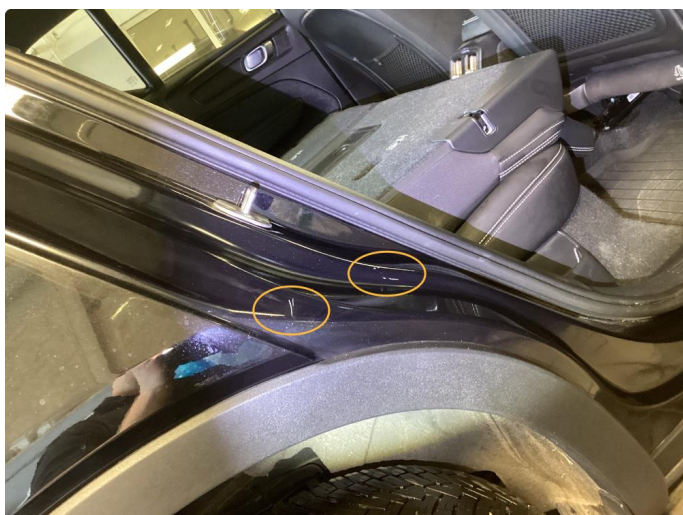
1.3 Riper (Repareres)