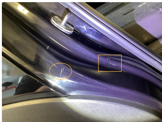
1.3 Riper (Repareres)