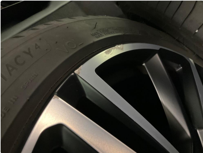
1.1 Bruksmerke på felg