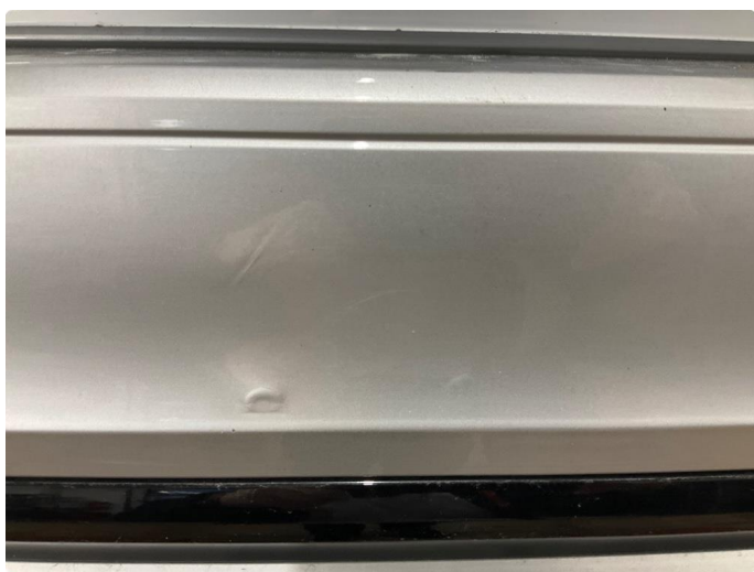
1.2 Skade (Reparert)