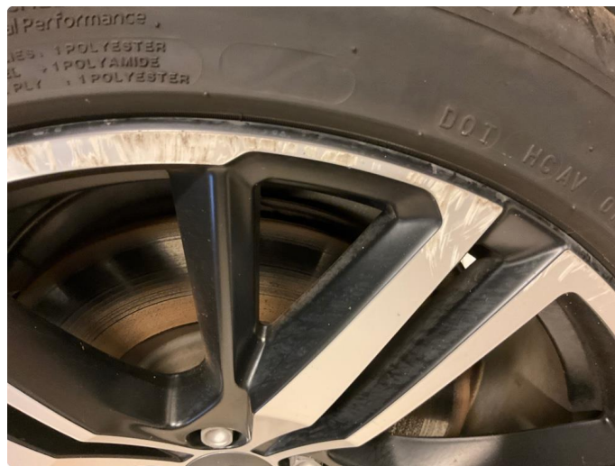
1.1 Skade på felg (Reparert)