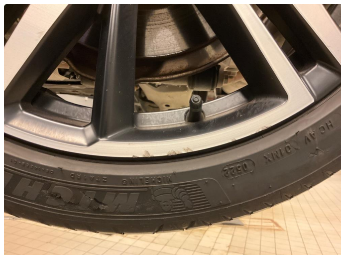
1.1 Skade på felg (Reparert)