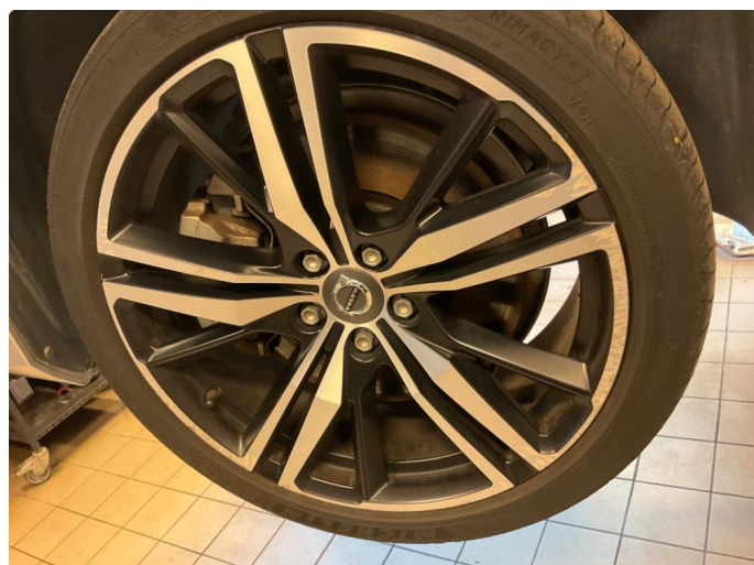
1.1 Skade på felg (Reparert)