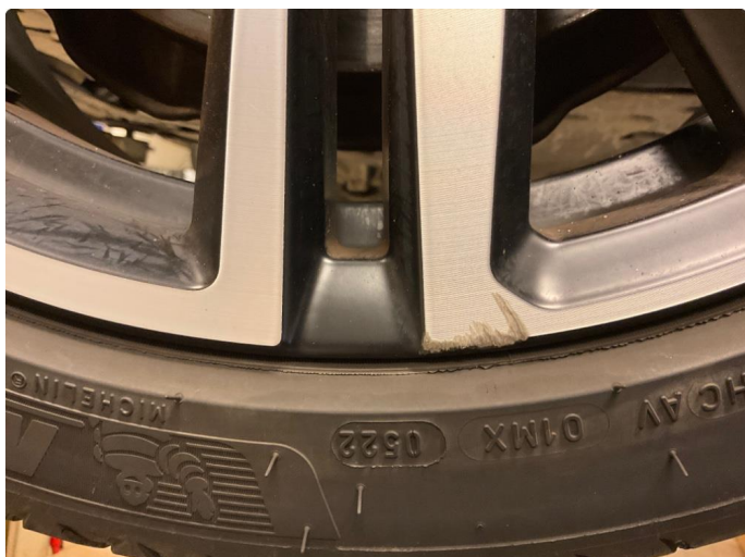
1.1 Skade på felg (Reparert)