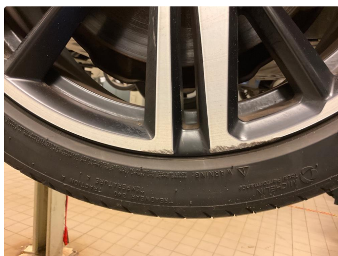
1.1 Skade på felg (Reparert)