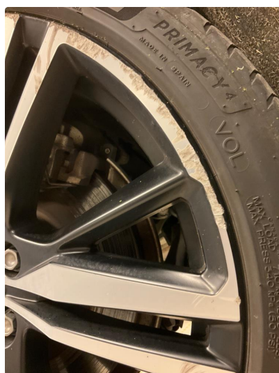
1.1 Skade på felg (Reparert)