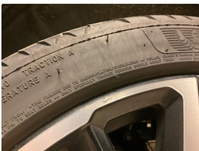
1.1 Skade på felg (Reparert)