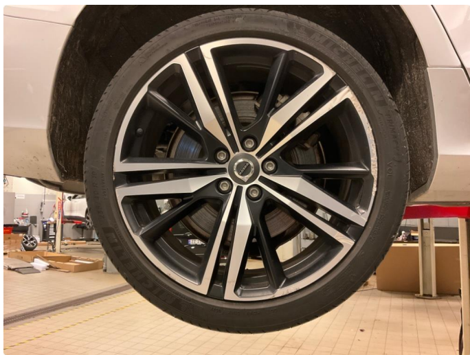
1.1 Skade på felg (Reparert)