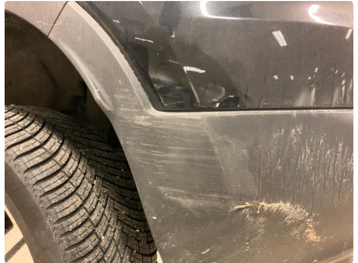
1.2 Ripe(r) ned til grunning (Reparert)