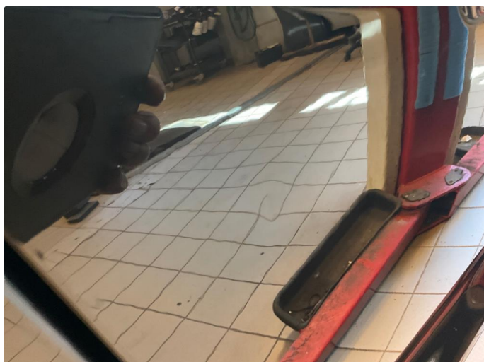
1.1 Bulk (repareres)