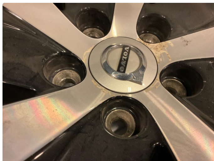
1.2 Påbegynnende oksidering (Repareres)