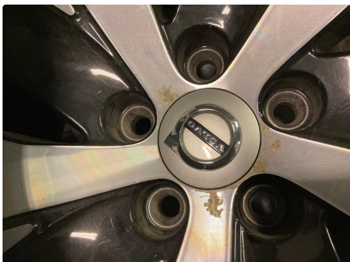
1.2 Påbegynnende oksidering (Repareres)