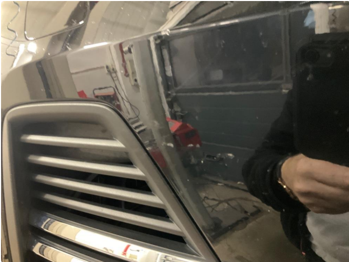
1.1 Ripe(r) ned til grunning (Reparert)