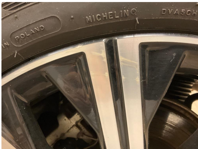
1.4 Skade på felg (Reparert)