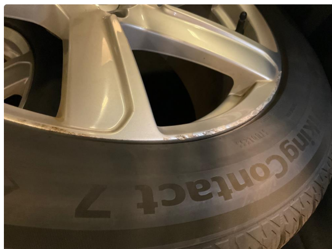
1.3 Ripe (r) gjennom lakk (Reparert)