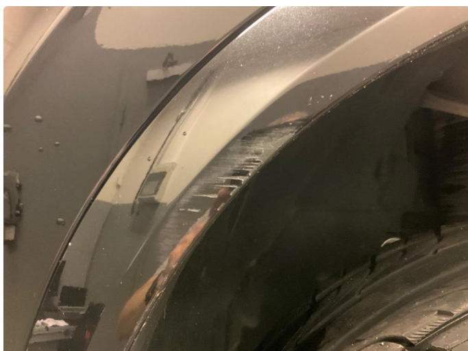
1.2 Skjermutbygger skadet (Reparert)