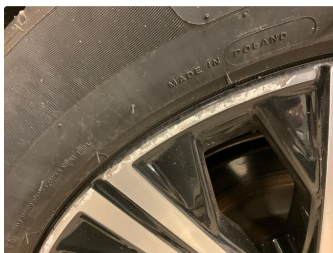
1.4 Skade på felg (Reparert)