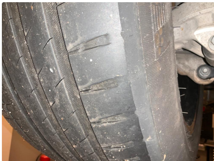
1.5 Skjev slitasje på sommerdekk