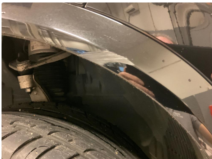
1.1 Skjermutbygger skadet (Reparert)