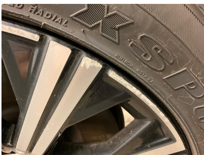
1.4 Skade på felg (Reparert)